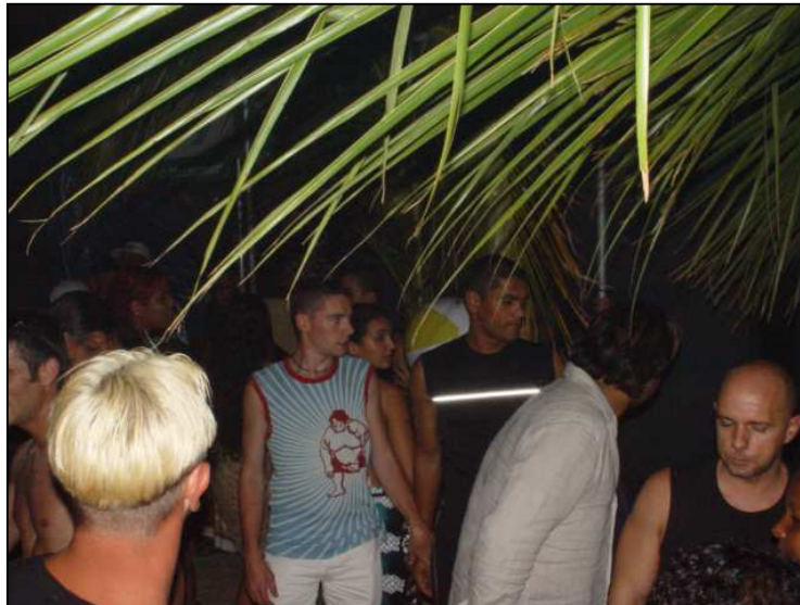
Photos 7 et 7bis: L'entrée du Queen's Club (g) et instantané lors une soirée plage (d).

Cette boîte de nuit, située rue Maréchal Leclerc, en partie haute près du « marché malgache », ouvre ses portes sur un parking bitumé en accès libre la nuit. Les jours d'ouverture de la boîte, ce parking se décompose en plusieurs zones en fonction de la luminosité et de la proximité de l'entrée du site. Le bâtiment est ancien.