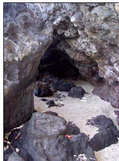
Photos 5 et 5 bis: Zone de la Grotte (g), intérieur de la Grotte (d)

Vers le centre de la fosse émergent du sol çà et là de petites parois de basalte qui forment des couloirs. Il est à noter que les à-pics de cette fosse sont accessibles et donnent une vue plongeante sur la partie basse. Faisant suite à ce rivage escarpé débute une première plage de sable blanc d'environ 150 mètres de long. La visibilité y est totale. C'est le seul endroit de fréquentation mixte mêlant homos et hétéros. Séparée par une bande rocheuse aisément franchissable d'environ 3 mètres de haut, commence ensuite la dernière partie du site qui est une succession de longues plages similaires les unes aux autres. Les accès sont éloignés de la route et bordés d'habitations. Le naturisme y est pratiqué mais ces espaces ne sont pas « ciblés ».