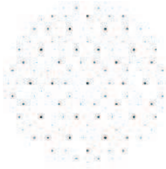
FIG. 1 – Diagramme de diffraction

Au printemps 1982, L'équipe de D. Shechtman, chercheur de l'institut de technologie Technion (Haifa), découvre au NBS à Washington DC dans un alliage d'aluminium et de manganèse rapidement solidifié, une phase ayant toutes les caractéristiques d'un cristal [SBDC]. Afin de connaître la répartition des atomes d'une telle structure, l'équipe réalise son diagramme de diffraction (voir la figure 1). Ce diagramme est discret et semblable à celui obtenu avec d'un cristal. A partir de ce diagramme, ils déduisent que