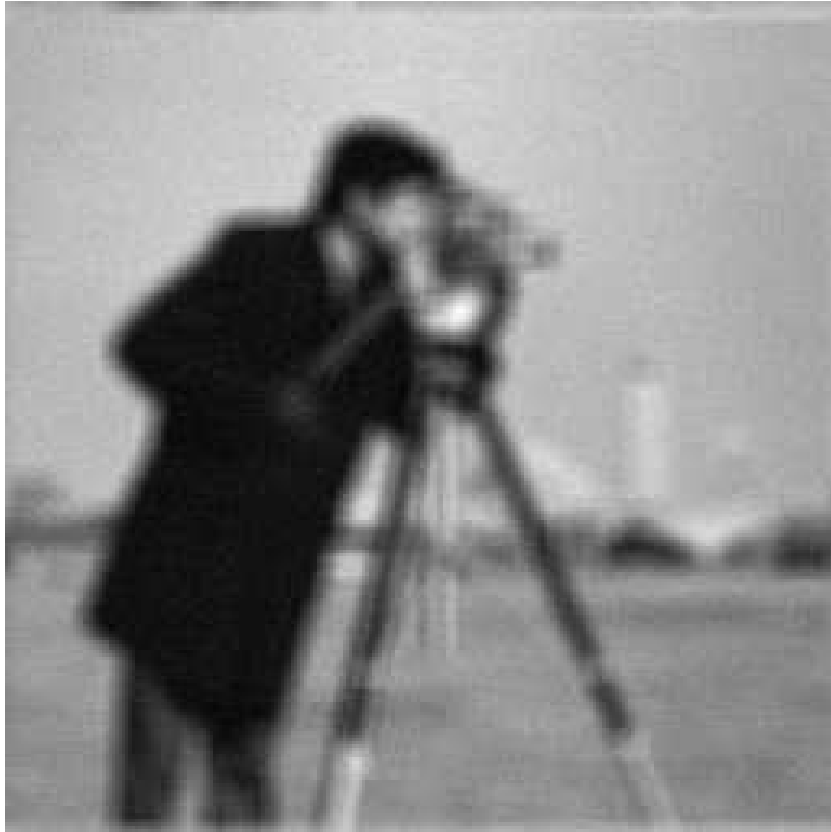
FIG. 6.2 – Image dégradée.

où la matrice N^2 \times N^2 , L , associée au noyau et la distribution des composantes du bruit u sont connues. La taille du noyau uniforme de convolution est 9 \times 9 . Le niveau du bruit est choisi de manière à ce que le rapport image floue/bruit soit