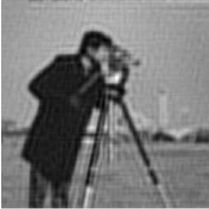
FIG. 6.3 – Image restaurée avec le filtre de Wiener.