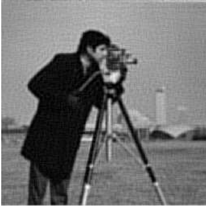
FIG. 6.4 – Image restaurée avec l’algorithme proposé.

Étant données ces contraintes, on illustrera la convergence d’une méthode itérative du type (6.126), utilisant les projecteurs associés aux convexes représentant les contraintes (voir [12], [13] et [14] pour les expressions de ces projecteurs). Plus précisément, en prenant \delta = 1/10 dans (6.119) et en choisissant \gamma = 10/11 , (6.121) se réduit à \text{Id} - \gamma \nabla f = 10P_C/11 . Dans ce cas particulier, l’algorithme (6.126) s’écrit sous la forme