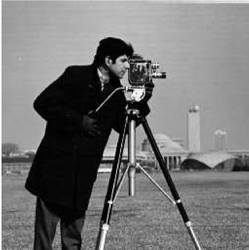
FIG. 6.1 – Image originale.