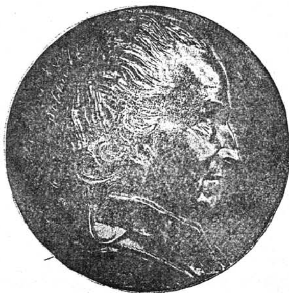
Buste de l'abbé Grégoire exécuté par David trois ans avant sa mort

Extrait de la Revue Juive de Lorraine, n° 72 ; 1er juin 1931 p. 124