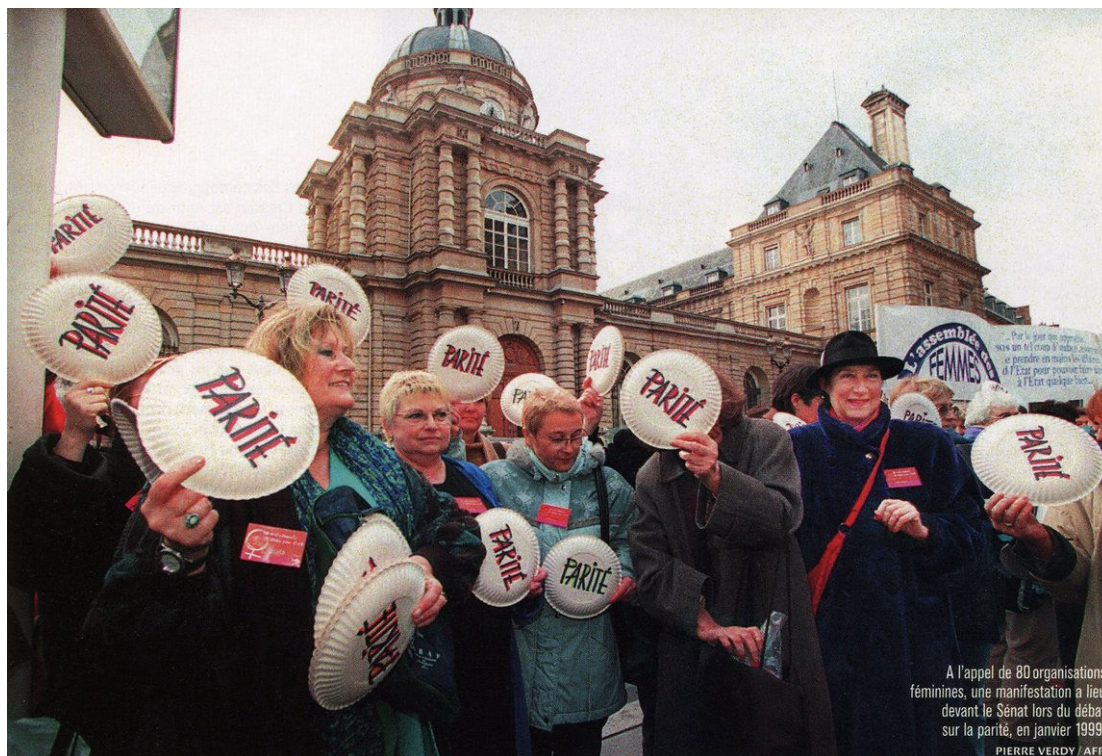
A l'appel de 80 organisations féminines, une manifestation a lieu devant le Sénat lors du débat sur la parité, en janvier 1999.

[ Le Monde 2, 18 avril 2004, p. 88, Photo Pierre Verdy/AFP]