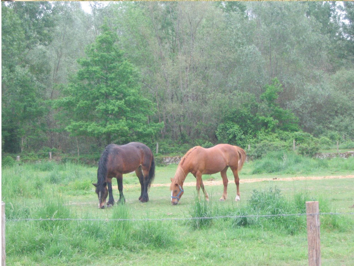
Les chevaux de la Clinique