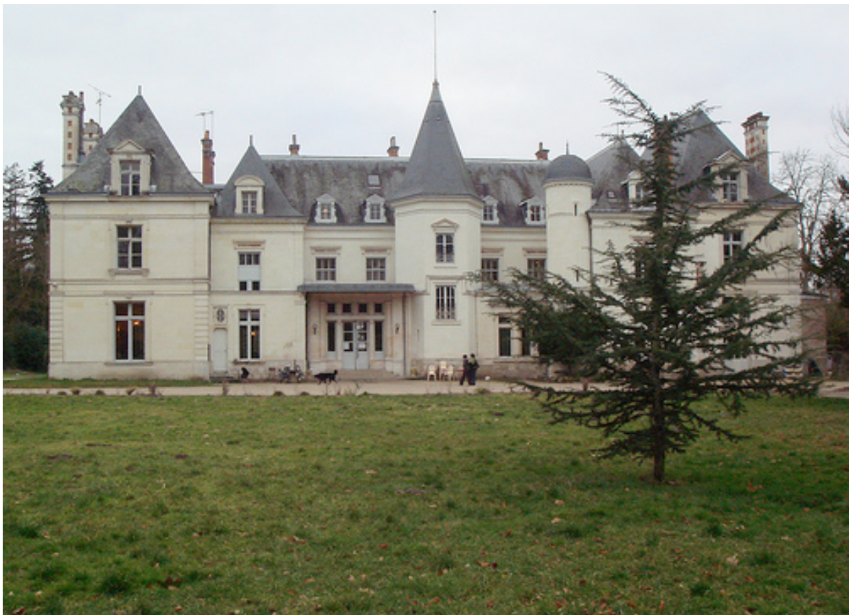
Le Château de La Borde