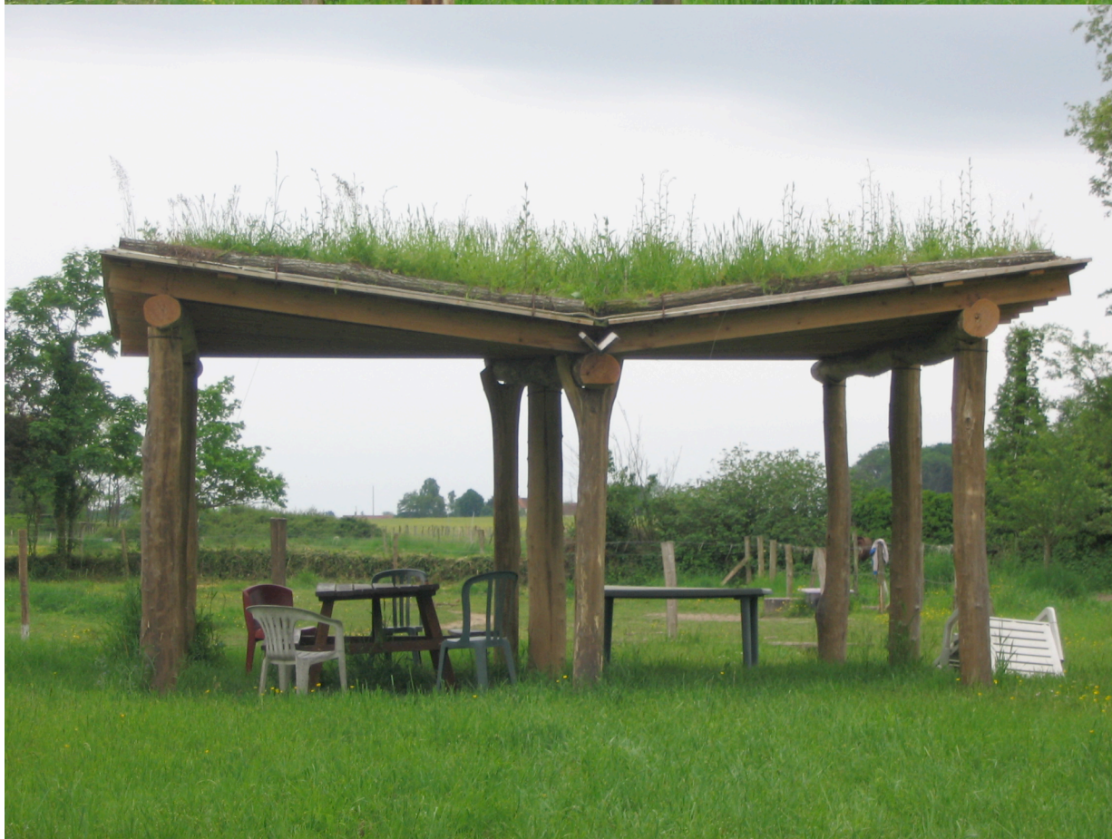
L'Abri pour écouter le paysage construit en 2005 par Christophe Cardoen et les labordiens