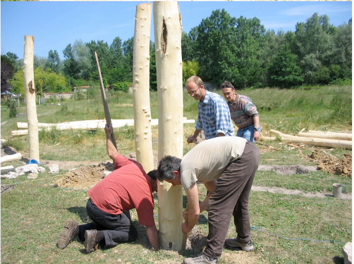
Construction de l'Abri pour écouter le paysage, été 2005