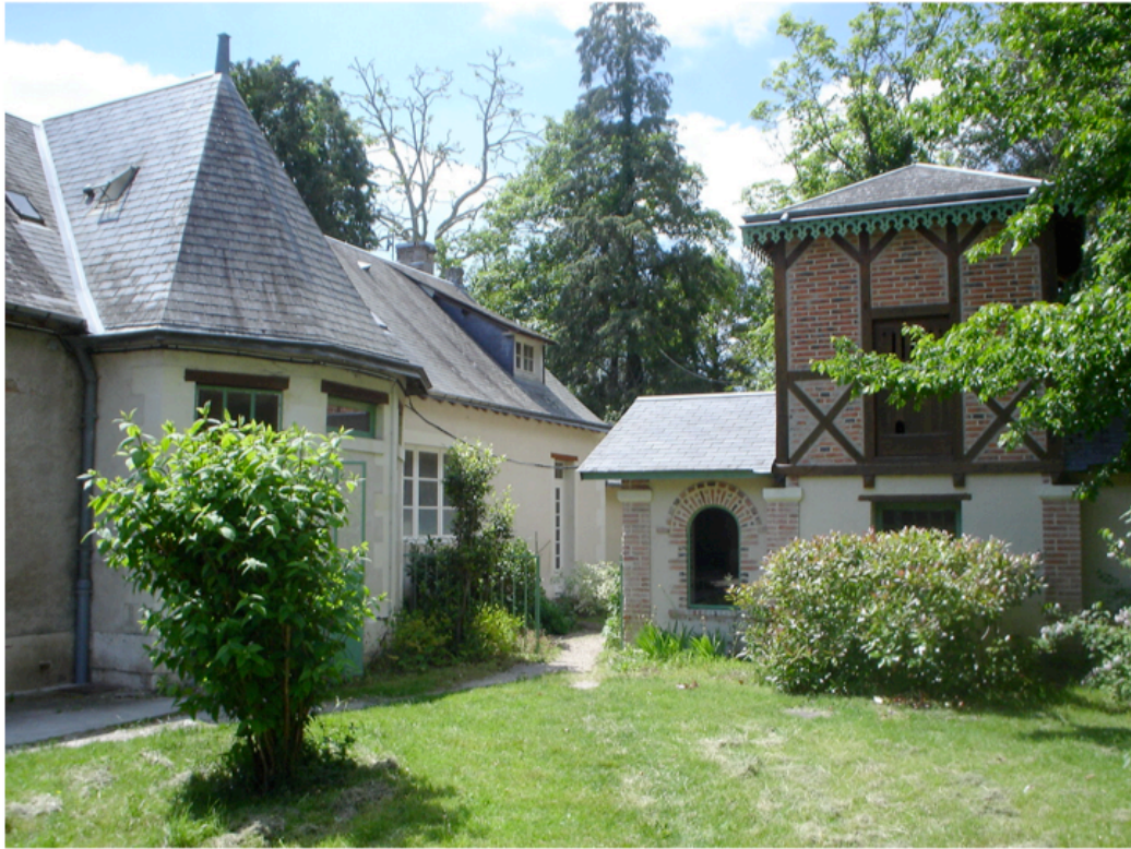
L'entrée depuis le parking des visiteurs 2