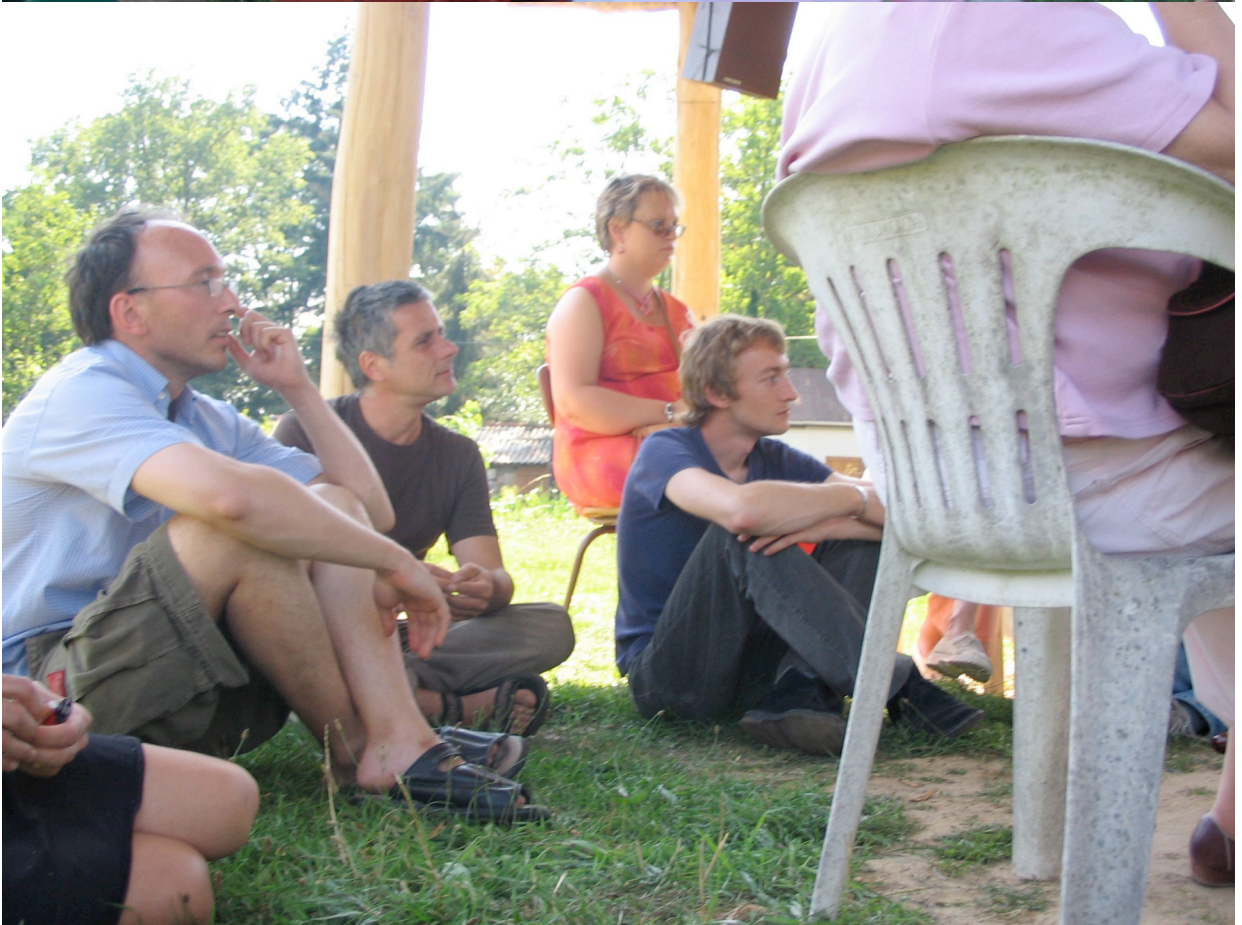
Deux moments d'écoute de l'installation sonore, été 2005