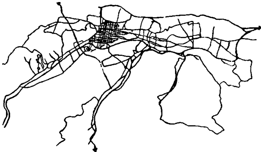
Schéma 6: Système des voiries principales de Caracas.

Parmi les voiries principales de Caracas se trouvent les autoroutes: de l'Est, qui a été construit dans les années 50 et qui traverse la ville de l'ouest à l'est; les autoroutes de El Valle, Caricuao, Prados del Este et la Cota Mil, qui ont été construites dans les années 60, qui desservent respectivement le sud-ouest, le sud, le sud-est et la vallée principale dans sa limite nord. Puis les grandes avenues: Urdaneta, Andrés Bello, Francisco de Miranda, Bolivar, Lecuna, Universidad, Mexico, Sucre, Rômulo Gallegos, en direction est-ouest; et les avenues Morán, Intercomunal del Valle, Intercomunal de Antimano, Baralt, Sanz, en direction nord-sud.