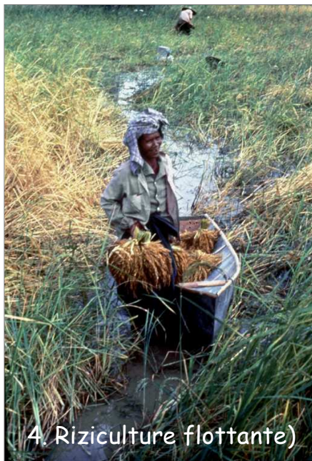
Planche photo n°1: Différents types de riziculture