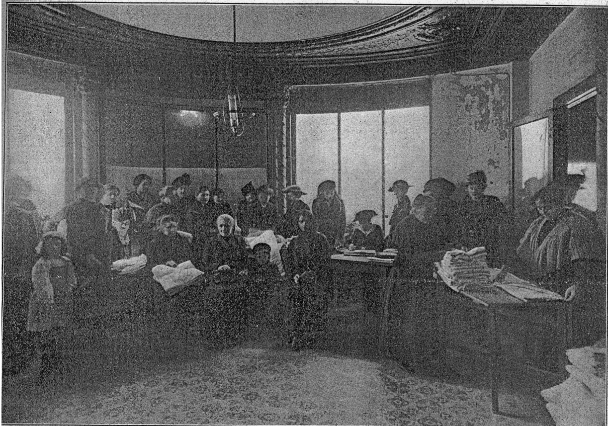
RÉCEPTION ET DISTRIBUTION DU TRAVAIL AUX OUVRIÈRES A DOMICILE