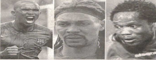
>>> P. 4

Ces Lions indomptables ont perdu la nationalité en obtenant une naturalisation dans leurs pays d'accueil, conformément à la législation en vigueur au Cameroun.