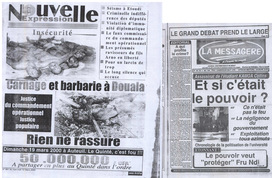
Image 7 et 8 : La Nouvelle expression du 15.03.00 et Le Messager du 04.05.93

L'image a par conséquent une force argumentative tributaire du texte qu'elle accompagne, force qui fait d'elle un acte indirect. Dans ce sens, par l'image – choc (ici des photos de morts), les journaux voudraient combler le fossé qui s'est créé entre la télévision, les nouveaux médias et eux. Dans ces images, on ne veut plus seulement dire la mort, on veut la montrer [9], on ne veut plus dire l'horreur [8], on veut la présenter. Est-ce la faillite du discours ? S'il y a faillite, à quoi est-ce dû ?