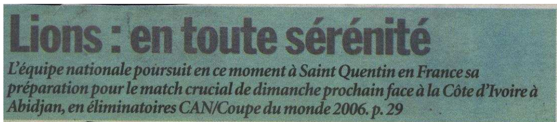
Image1 : Titre de presse extrait de Cameroon Tribune du 30.08.05

On peut déjà, pour notre unité de traitement, penser à une organisation morpho-dispositionnelle et syntaxique en trois séquences : une séquence "situative", une séquence informative et une séquence explicative ou présentative. La déclinaison des nouvelles 24 la plus régulière, le type le plus courant dans les médias écrits francophones du Cameroun est la double articulation (titres bipartites ou bisegmentaux ) et, en principe pour les titres "majeurs", la triple articulation.