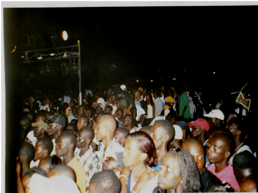
Public lors d'un concert de rap au Centre Culturel Blaise Senghor.

transposée dans le contexte réel. Au terme des nombreuses expériences de spectacles et de représentations qui ont jalonné mon terrain, je proposerai la réponse suivante : à mon sens, le rap à Dakar se révèle être un mode d'expression paradoxal, dans la mesure où il revêt des caractéristiques à la fois intégratrices, cherchant à concerner, voire à séduire la plus grande partie de la population locale, et sélectives, puisqu'il est codifié, même si c'est à divers degrés selon les groupes et les tendances. En effet, le degré de codification et par la même d'hermétisme des textes de rap s'avère très variable en fonction du style d'écriture adopté par chacun des groupes, de leurs postures et de leurs symboles ; tel groupe va jusqu'à créer son propre thesaurus et modifier comme bon lui semble la syntaxe du wolof ou du français (c'est par exemple le cas de « Nonni nonne »), tandis que d'autres s'assurent un public beaucoup plus large, mais également disparate, en choisissant délibérément des thèmes susceptibles d'intéresser le plus grand nombre, en s'exprimant dans un langage accessible, conventionnel et en cultivant une attitude qui soit un savant mélange de sagesse et d'audace, propice à séduire les foules : ici, je pense à l'exemple de « Daara J ».