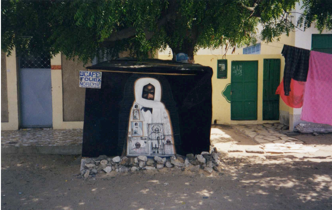
Portrait de Cheikh Ahmadou Bamba ; quartier de « La Gueule tapée », Dakar.

Pacotille compte parmi les rappers qui se sont le plus illustrés dans ce domaine, notamment à l'occasion de la sortie de son morceau « Yonu Jub », dans la compilation « Yes ». Ce titre, qui signifie « la voie de la droiture », se définit très explicitement comme une chanson de louanges adressées aux marabouts des principales confréries soufies du Sénégal. Dès lors, il se démarque de la tendance générale, en prenant le parti de vanter les mérites de chacun des serigne du pays, et en prodiguant le conseil de suivre leur exemple, ainsi que de les chérir. Habituellement, le registre des louanges est réservé aux griots, et plus récemment aux artistes de mbalax . C'est pourquoi cette implication spirituelle inopinée a pu paraître surprenante aux yeux de la communauté sénégalaise.