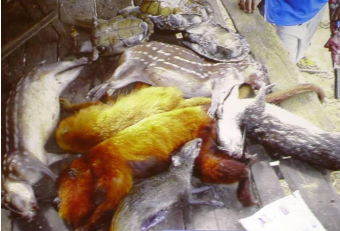
Figure 5 : Tableau de chasse à Kumarumã. On distingue trois tortues Podocnemis , trois pacas, deux singes hurleurs et un agouti.