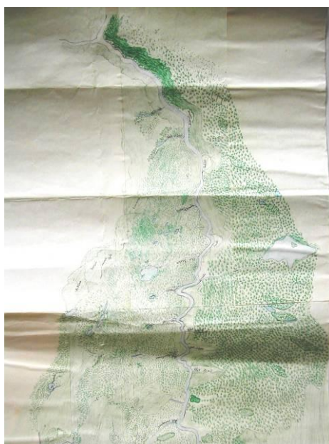
Figure 4 : carte figurant le fleuve Uaçá dessinée par un Indien Galibi Marworno.

Dans l'Uaçá, seuls les pajés ont accès aux lacs enchantés, eux seuls exercent le pouvoir de médiation entre les hommes et les esprits-maîtres dits karuãna ; ils se posent donc, apparemment, en garants de l'équilibre entre peuplement humain et sauvegarde des ressources, dont ils pourraient, selon leurs capacités, libérer ou restreindre l'accès. Mais l'idée que la forêt ou certaines espèces animales ou végétales pourraient s'éteindre est contredite par la foi en le pouvoir des Mères de repeupler les lieux dévastés. Il y a dans ce constat un aveu d'impuissance de la part du pajé, qui traduit le fait que les équilibres écologiques, en vérité, ne sont pas de son ressort. Pour expliquer la disparition puis la réapparition du caïman noir ( Melanosuchus niger ), un pajé évoque l'enfermement de leur souche par la Mère des Caïmans dans une prison dont les barreaux et le cadenas commencent à s'éroder. La régulation des flux végétaux et animaux par l'intervention des esprits maîtres s'oppose ainsi frontalement à l'opinion et à la politique même des organes de protection de l'environnement, IBAMA en