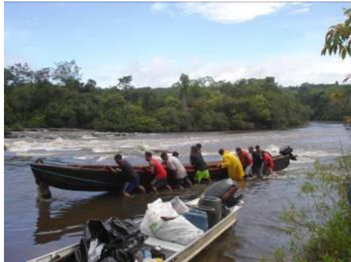
Figure 6 : Franchissement des sauts de l'Iratapuru. L'entraide est obligée.

d) Topographie rendant nécessaire la coopération. La pratique extractiviste elle-même est facteur de cohésion : la solidarité est indispensable au franchissement des sauts de l'Iratapuru, sans parler des pannes de moteur ou des urgences médicales. La sociabilité en forêt se manifeste par des arrêts chez ceux de l'aval avant de reprendre la remontée des igarapés : pas d'électricité donc la sociabilité est fondée sur