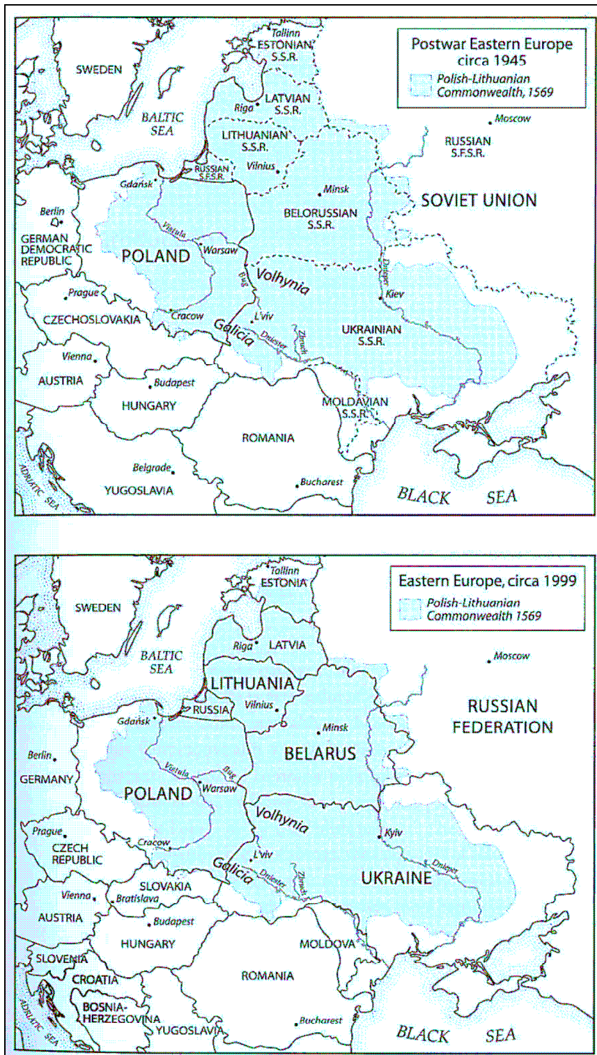
Cartes tirées de l'ouvrage suivant : SNYDER Timothy, The Reconstruction of Nations – Poland, Ukraine, Lithuania, Belarus, 1569-1999 , New Haven & London, Yale University Press, 2003, pp.xiii-xv.