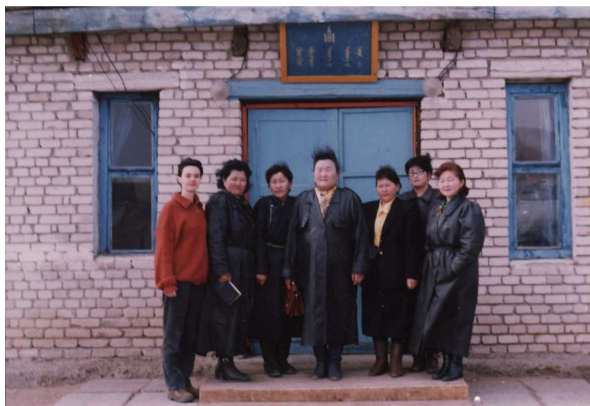
Militantes locales de Holonbuir sum , Dornod, 24 avril 1999.