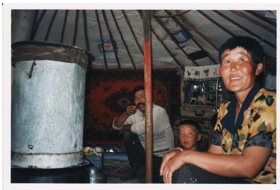
Fabrication de l' arbi chez Zundujžams, été 2001