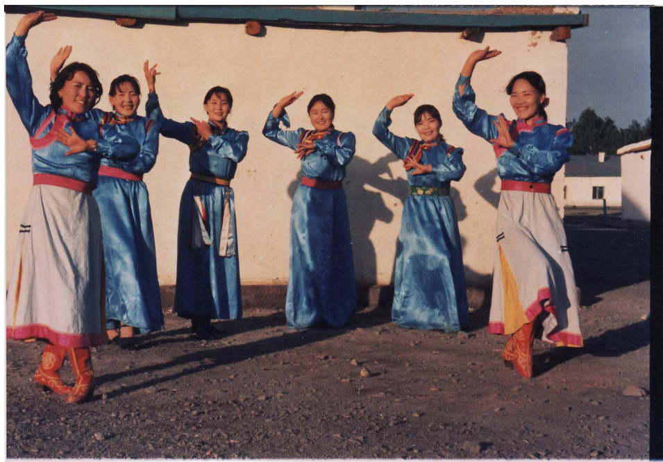
Danseuses de Čandamand, fête de la démocratie, 1 er juin 2001.