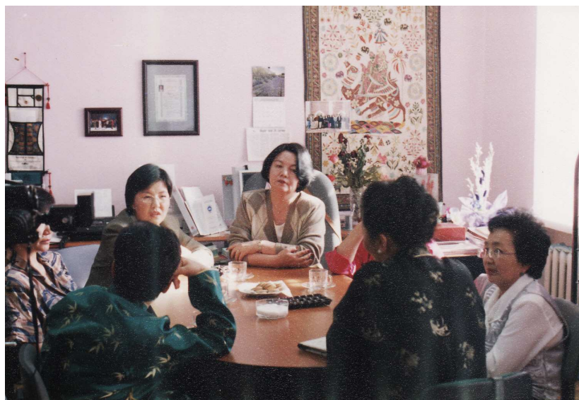
Une des réunions de la Coalition des Femmes, dans les locaux du Comité CEDEF.