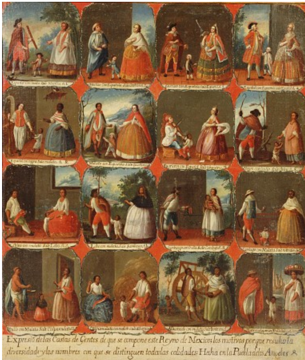
Illustration 1: Cuadro de castas, México Colonial.

relations Portugais / Indiens donnera un tour particulier à la société qui se met en place. L'esclavage noir, lié à l'exploitation de la canne à sucre (après son acclimatation par Souza en 1530) représente l'introduction de plusieurs millions d'Africains pendant les trois siècles de colonisation. Cette population fut moins importante dans l'empire espagnol. 1029 D'autre part, il n'y avait pas au Brésil de grands empires indiens organisés, comme chez les voisins castillans. Ce qui induisit, dans la première phase de la colonisation, des rapports plus ponctuels, organisés autour du raid et de l'échange, plus qu'autour de la colonisation. Nous ne trouverons pas le principe dualiste d'organisation du territoire, mais une société à l'intérieur de laquelle