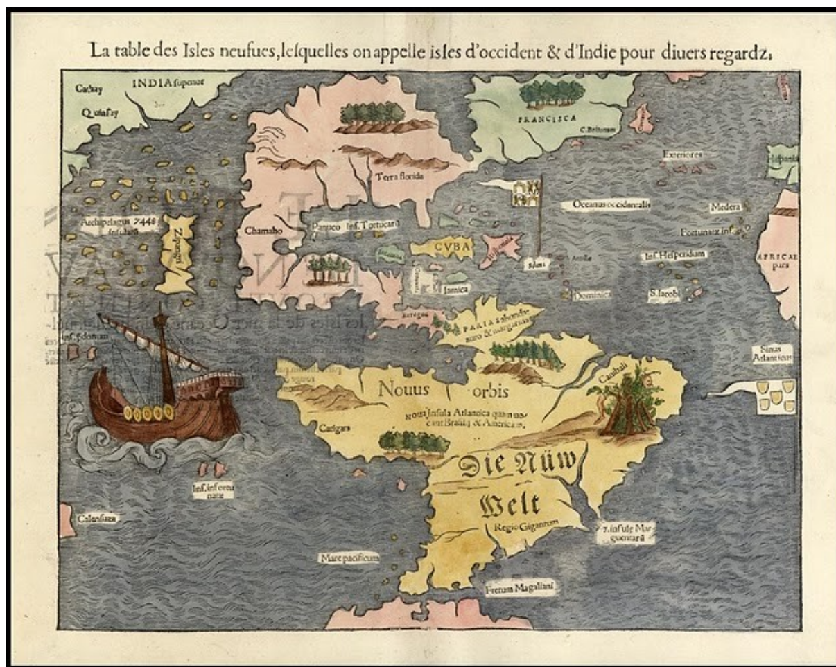
Illustration 3: Novus Orbis . Sebastian Münster en su cosmografia universal . 1544.

Sur la carte d'Apaina de 1545, c'est la même chose. Le Brésil est une terre d'anthropophages. Enfin, la carte de Sébastien Munster, de 1538, la première à être consacrée uniquement à l'hémisphère occidental, et qui fut la principale source de diffusion des connaissances géographiques pendant de nombreuses années reprend le motif de la hutte anthropophage.