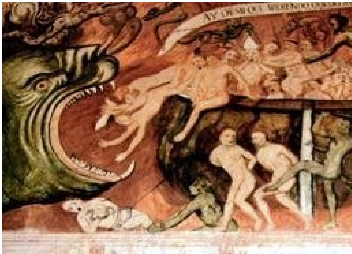
Illustration 13: El Juicio final, Iglesia de Huaró, Tadeo Escalante, Siglo XVIII.

L'Enfer de López de Los Ríos, à Carabuco, correspond à cette partition : nous voyons en effet deux mondes, au dessus et au dessous d'une ligne ténue. L'image est divisée en strates horizontales, dont la plus importante représente le lieu des Damnés ; au dessus, des scènes terrestres permettent au fidèle de reconstruire le lien entre les péchés commis durant la vie et la punition qui l'attend dans l'au-delà. 1112