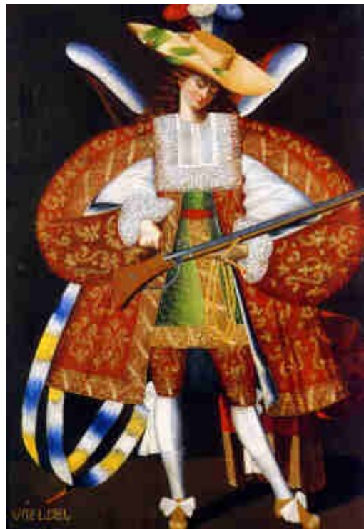
Illustration 8: Uriel, maestro de Calamarca.

Ces tableaux ne représentent pas seulement des archanges mais aussi des anges gardiens, des Dominations, des Trônes et des Vertus. Il est possible de différencier deux groupes : les anges en armures et cothurnes, vêtus à la romaine, et les arquebusiers, habillés à la manière des soldats de l'époque. Le critique d'art Sebastián Santiago 1085 note à propos du deuxième groupe qu'il constitue un cas exceptionnel dans la peinture des Indes. Le vêtement est unique : les archanges sont habillés à la mode du XVII e siècle, avec des pourpoints à basquines, des bas et des chaussures à boucle. Ils portent de grands chapeaux, décorés de panaches, et des flots de dentelle s'échappent des crevés de leurs vestes. Soldats émérites, ils pointent vers le ciel des arquebuses qui barrent les tableaux d'une oblique polémique. Leurs cols en fine dentelle, les tissus colorés et les plumes chatoyantes qu'ils portent contrastent avec la sobre tenue de leurs émules de la Nouvelle Grenade, de la Nouvelle Espagne ou de la métropole.