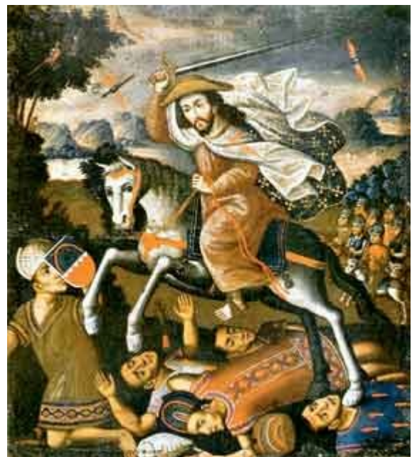
Illustration 6: Santiago Mataindios, Colonia, Anónimo,

Mais peut-être aussi d'autres voies ont-elles été trouvées pour conquérir les âmes ? Saint Michel ressemble de plus en plus à un saint et de moins en moins à un ange. Le saint de la Reconquista, lorsqu'il s'acclimate en Amérique, deviendra celui de la Conquista, sur le modèle d'un autre, déjà évoqué dans ces pages, Santiago, le vainqueur des Maures. Il est intéressant de constater que Santiago est toujours représenté levant le bras pour pourfendre un soldat maure à ses pieds, le piétinant avec son cheval, dans une position finalement très proche de celle qui était évoquée plus haut pour Michel.