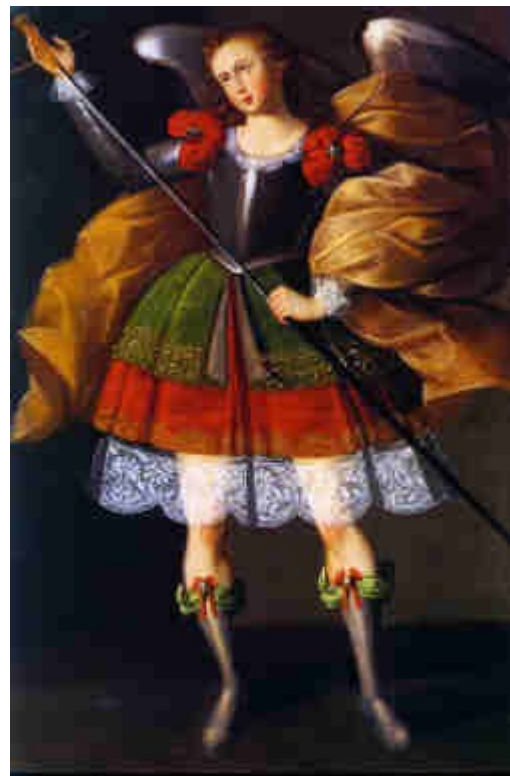
Illustration 9: Zadquiel, Maestro de Calamarca.

Quoi qu'il en soit, qu'il y ait anthropomorphisme ou au contraire divinisation, tous ces archanges mènent la garde, font de l'ordre et punissent. Certains incarnent le pouvoir temporel et d'autres comme Zadquiel, s'accordent mieux à représenter le pouvoir spirituel : leur