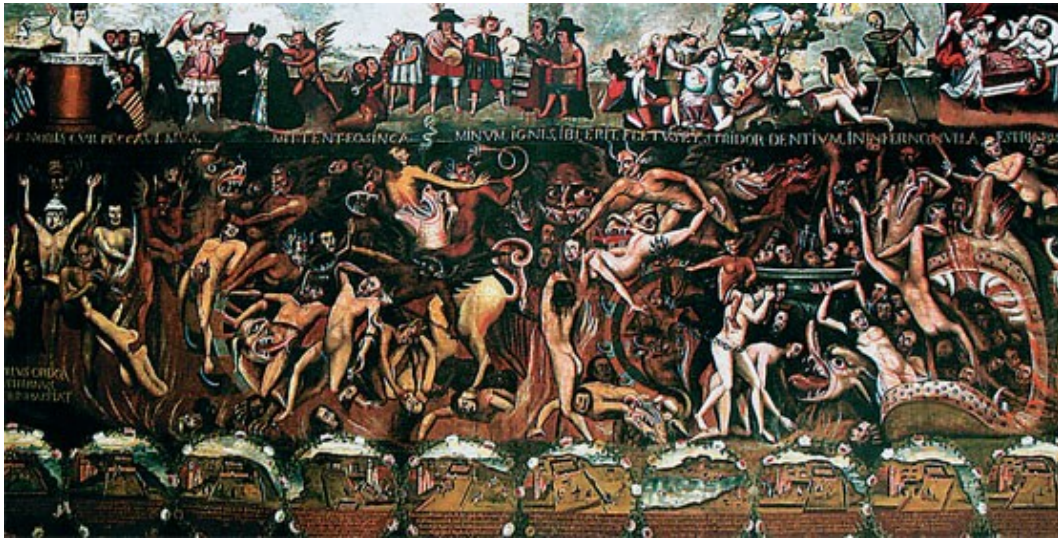
Illustration 12: Infierno, Lopez de Ríos, Carabucco, Siglo XVII.

l'Enfer.». Dès lors, de nombreuses fresques furent-elles peintes, dont certaines couvrent de manière spectaculaire toute la nef d'une église. 1110