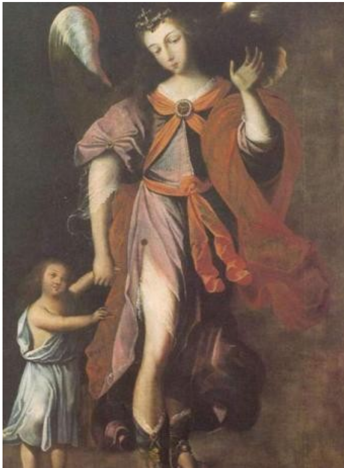
Illustration 10: Angel custodio , Sopo, Siglo XVII.

Le tableau de l'ange gardien, de la série dite « des douze archanges », se trouve dans une petite ville coloniale des environs de Bogotá, Sopo. Intitulée Angel custodio , cette œuvre est une peinture à l'huile de deux mètres trente-huit sur un mètre soixante.