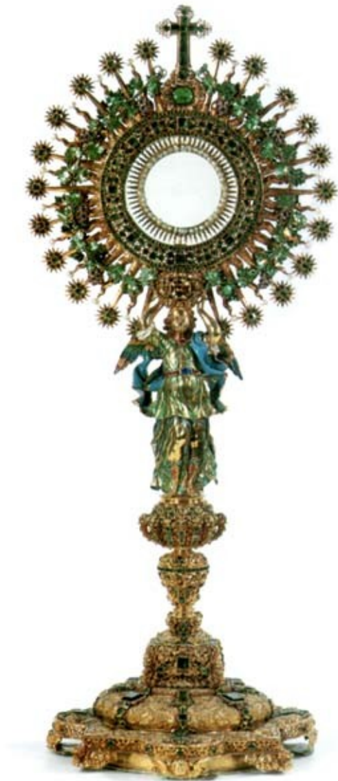
Illustration 11: Custodia "la lechuga", Colombia, Siglo XVIII.

suit le premier Dimanche de la Pentecôte. 1101