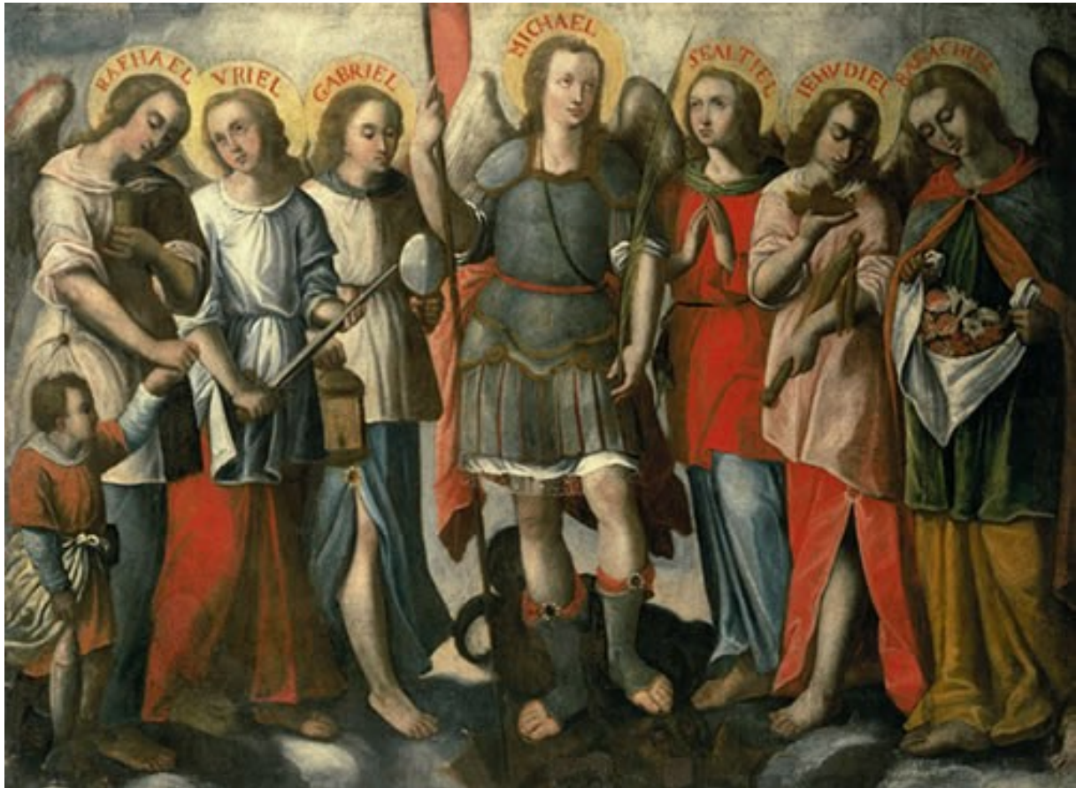
Illustration 7: Los siete arcángeles, Anónimo, Museo Pedro de Osma, Lima.

Ce qui frappe dans la production des archanges de l'époque coloniale, c'est qu'ils sont conçus en série, de sept ou douze. Très souvent, les commandes s'accompagnent de celles d'un nombre équivalent de saints. Sur les tableaux des Indes, les archanges vont donc peu à peu proliférer. Les plus célèbres, Michel, Gabriel, et Raphaël, sont très souvent représentés, mais on en trouve également d'autres, plus rares en Europe : Uriel, Baraquiel, Esriel, Jehudiel, Laruel, Seactiel, Ariel. La papauté avait autorisé le culte de trois d'entre eux : Michel, Raphaël, et Gabriel. Les autres étaient suspectés d'accointances fâcheuses avec le démon, même Uriel, pourtant accepté par l'église orthodoxe. A partir du XVI e siècle, en Europe comme aux Indes, les archanges prohibés seront représentés, malgré le zèle souvent impuissant de l'Inquisition.