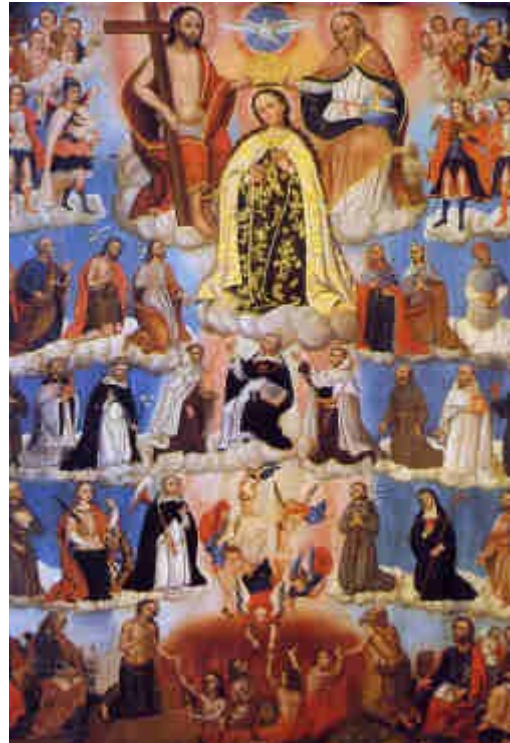
Illustration 4: La Corte celestial, Rossel, Siglo XVIII.

La Cour céleste de l'anonyme péruvien montre à l'étage supérieur, et au centre, la Trinité. Jésus se trouve à gauche et l'Esprit Saint, sous forme de colombe, au milieu, à droite. Dieu est assis. Comme il est dit dans la Bible , Jésus et Dieu flottent sur des chérubins. A l'étage inférieur, à gauche, la Vierge et des saintes sont agenouillées ; à droite, nous voyons plusieurs saints, et au centre, soutenu par d'autres angelots, un immense