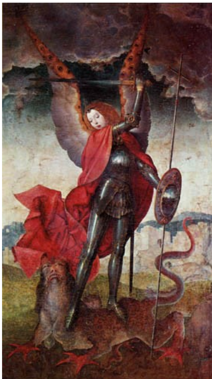
Illustration 5: San Miguel , Juan de Flandes, 1506.

Le démon est le plus souvent un dragon. Parfois il a forme humaine, d'autres fois, il ressemble à un monstre : il a un corps d'homme, une queue de dragon ou de serpent, et des ailes de chauve souris. Symboles catamorphes (l'ange déchu, Satan, est jeté à terre), ascensionnels