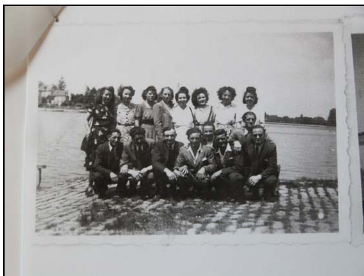
Cliché n° 5 137

de l'école/patronage. Plus âgée encore, vers 17-18 ans, mais interdite de bal par des parents rigoristes, elle commence à sortir « toujours en groupe, jamais à deux, oh ben non ! » pour aller s'amuser aux assemblées de pays, où l'on trouve des « tas de petites boutiques, des manèges, des balançoires, des auto-tamponneuses ». Garçons et filles sont alors autorisés à sortir ensemble sans surveillance.