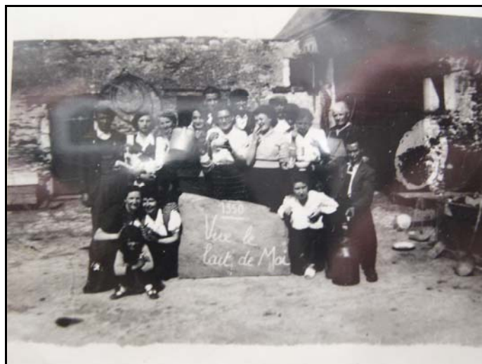
Cliché n° 6 138