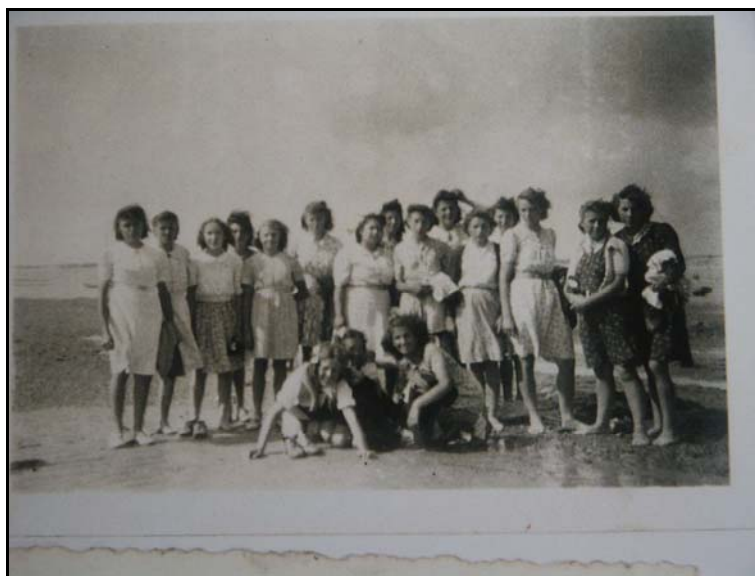
Cliché n° 26 263