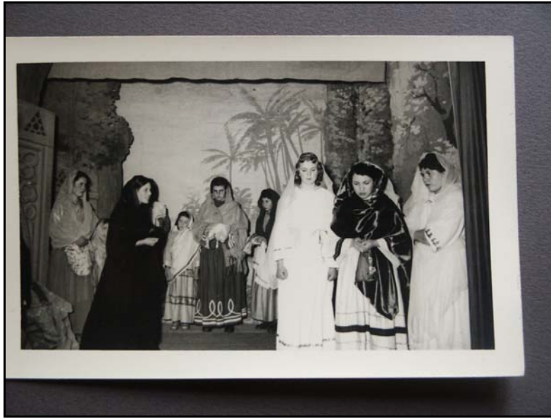
Cliché n° 31 285