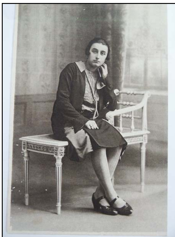
Cliché n°19 157

Peu de traces avant la fin des années quarante dans les clichés fournis par les témoins de tenues spécifiquement dédiées aux jeunes filles telles que les proposent pourtant, dès le milieu des années trente, les patrons des suppléments féminins des journaux locaux. Dans les campagnes angevines, des années vingt au lendemain de la Seconde Guerre mondiale, dès 13 ou 14 ans, la plupart des témoins sont au quotidien habillées comme leurs mères. Distance au sol de l'ourlet, emplacement de la taille, angle et position des pinces de poitrine sont les mêmes. À la métamorphose progressive du corps enfantin en corps juvénile, s'oppose un changement brutal et intégral du code vestimentaire dès que les formes s'enrobent.