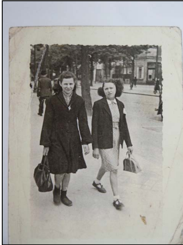
Cliché n°21 159

la charnière des années vingt et trente, la socquette roulée sur la cheville, à équidistance symbolique de la chaussette tirée haut sur le mollet des petites filles et des bas couleur chair mettant à nu les jambes des femmes, fait partie des signes distinctifs de jeunesse.