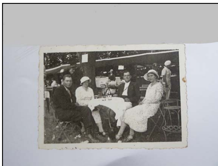
Cliché n°7 140

Les photographies 139 fournies par les témoins montrent des groupes constitués de filles et de garçons déjà relativement âgés. Aucun chaperon ne les encadre ; les adultes présents sur le cliché n°6 sont les fermiers accueillant la troupe pègrine en quête de lait. Ces sorties en groupes hétérosexués, pas forcément paritaires, composés de garçons et de filles réunis pour l'occasion plus que de couples, précèdent une dernière recomposition de la mixité juvénile marquée par l'association de deux ou trois couples « officiels » autorisés à sortir ensemble. Ce réaménagement prépare à la sociabilité postnuptiale recentrée sur les relations interfamiliales.