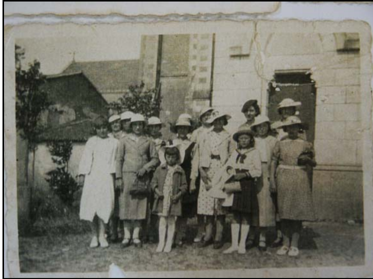
Cliché n° 25 260

la ferme le dimanche matin par les soins à donner aux animaux, « y en a qui allaient à la messe, rien que pour faire voir leur toilette ».