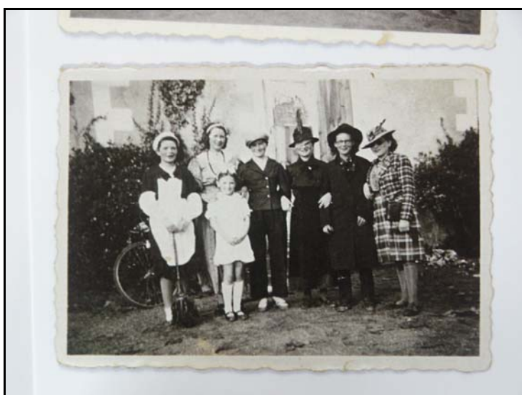
Cliché n° 29 283

La témoin (troisième à droite au second rang), libre penseuse, appartient à une société de jeunesse féminine douessine laïque Le Printania . Pas plus que dans les troupes de patronage paroissial on n'y mélangeait à l'époque garçons et filles.