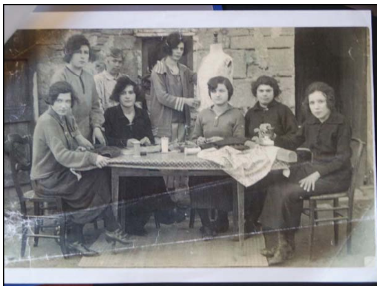
Cliché n°24 244

Un atelier de couture aux Verchers-sur-Layon vers 1929(13,5 × 8,5 cm, noir et blanc, professionnel).