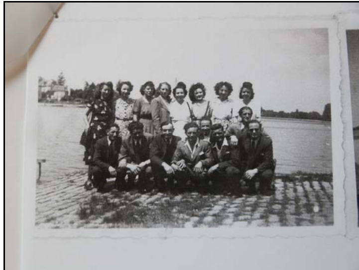
Cliché n° 5 137

de l'école/patronage. Plus âgée encore, vers 17-18 ans, mais interdite de bal par des parents rigoristes, elle commence à sortir « toujours en groupe, jamais à deux, oh ben non ! » pour aller s'amuser aux assemblées de pays, où l'on trouve des « tas de petites boutiques, des manèges, des balançoires, des auto-tamponneuses ». Garçons et filles sont alors autorisés à sortir ensemble sans surveillance.