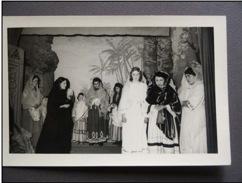
Cliché n° 31 285