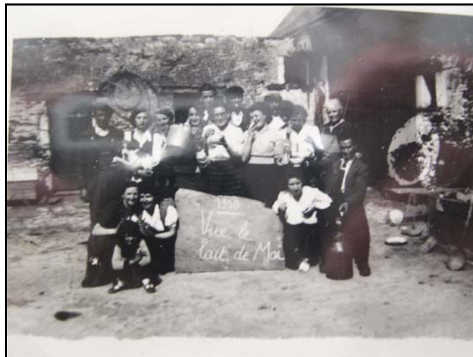
Cliché n° 6 138