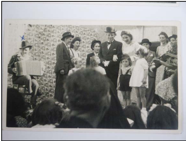
Cliché n° 30 284

Troupe théâtrale du patronage de Notre-Dame-d'Allençon en 1946 (13,8 × 9 cm, noir et blanc, amateur).