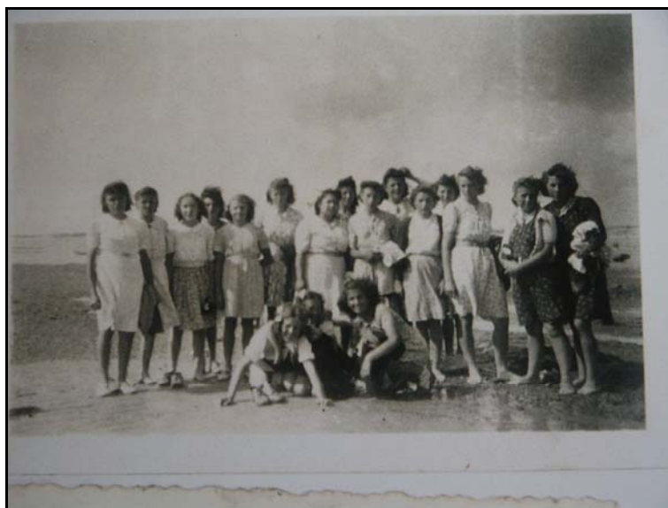
Cliché n° 26 263