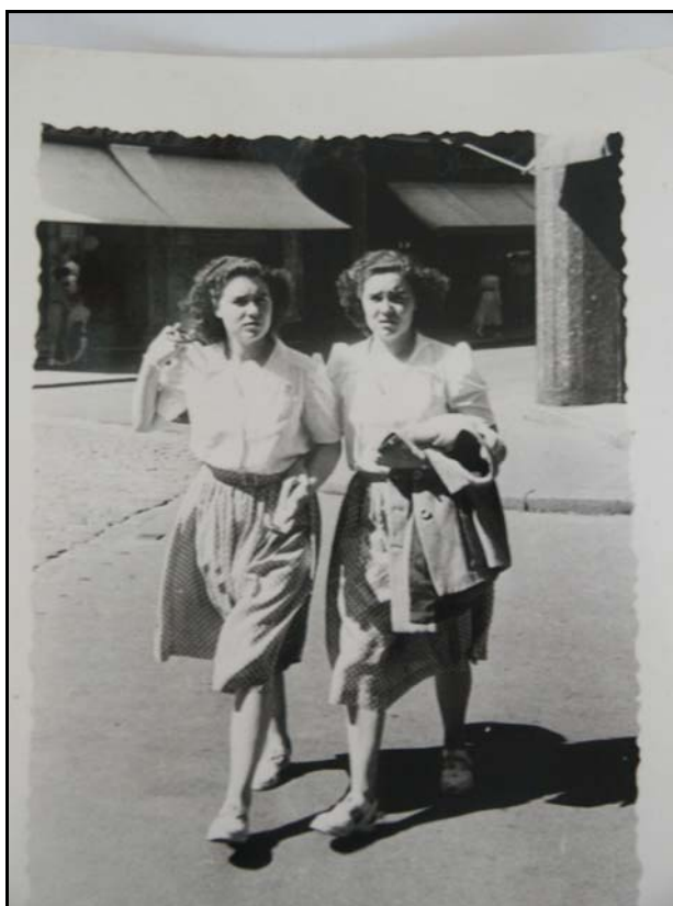
Cliché n°20 158

La « transition juvénile-vestimentaire », marquée par des vêtements spécifiquement coupés pour les jeunes filles est le fait d'une minorité née le plus souvent dans les années trente. De nouveau les jumelles de la Meignanne, filles du bourg et apprenties couturières, se distinguent de leurs camarades par des tenues adaptées à leur condition de jeunes filles acculturées.