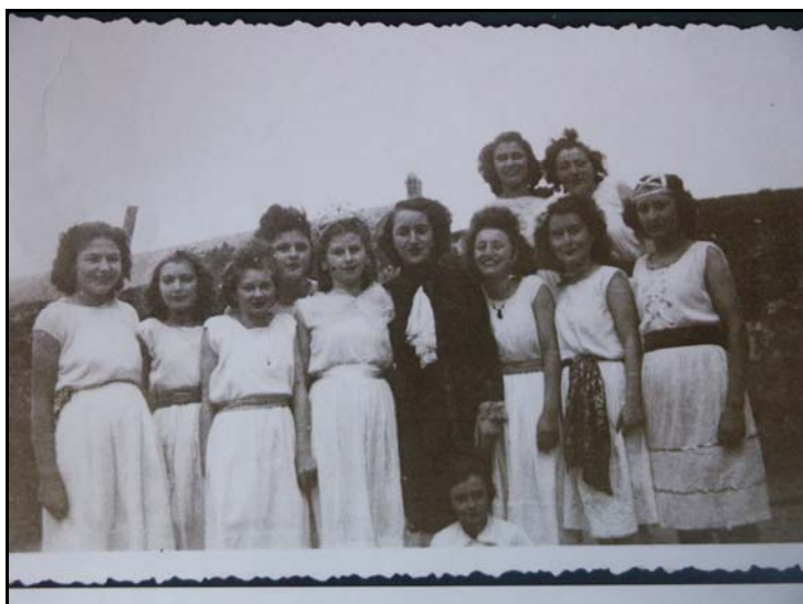
Cliché n° 28 282

Troupe théâtrale de la Société Printania à Doué-la-Fontaine en 1942(9 × 6 cm, noir et blanc, amateur).