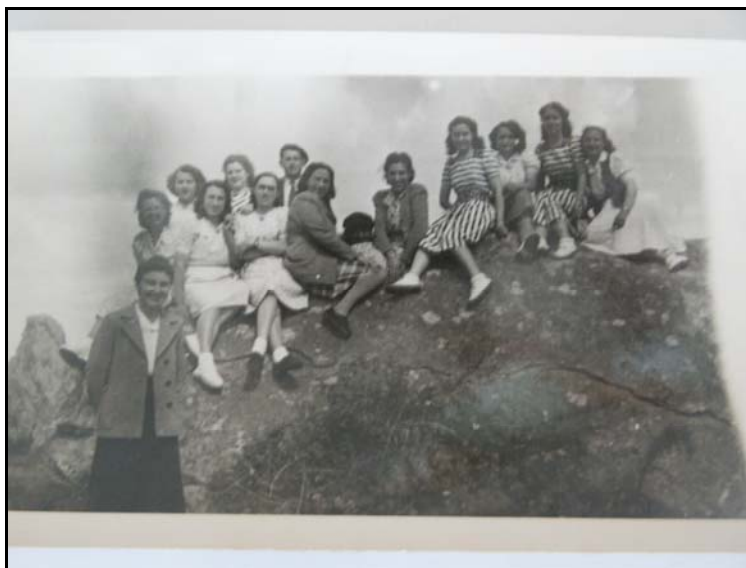
Cliché n°27 264

La sortie de deux jours qui mena également la témoin et ses camarades (dix-huit jeunes filles entre 12-13 ans et une vingtaine d'années) à Saint-Malo était organisée par le curé de la paroisse. C'est lui qui prit la photographie des ses jeunes ouailles les pieds dans l'eau.