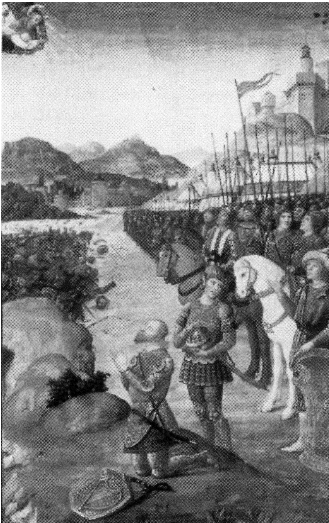
Figure 2. BnF ms. lat. 10491, fol. 147v Diurnal de René II de Lorraine (1492 et 1494), ps. 26.