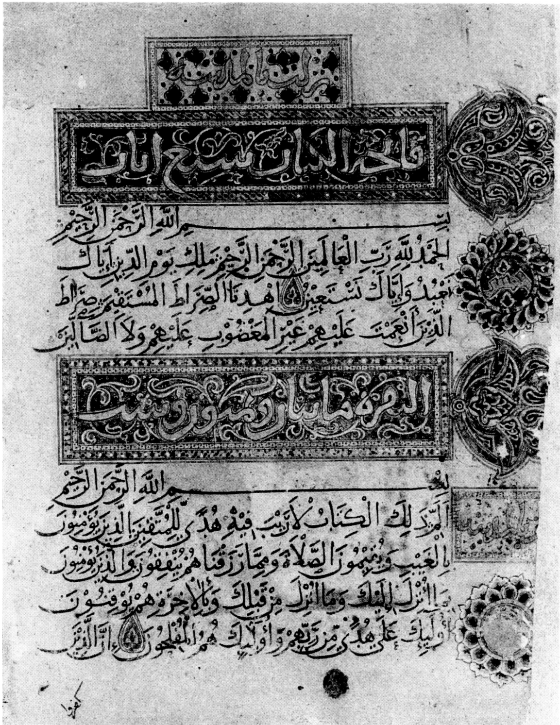
Figure 4 bis. Chester Beatty Library, Dublin, Add.11735, f. 9 v Coran , (Ibn al-Bawwab, Bagdad, 1013).