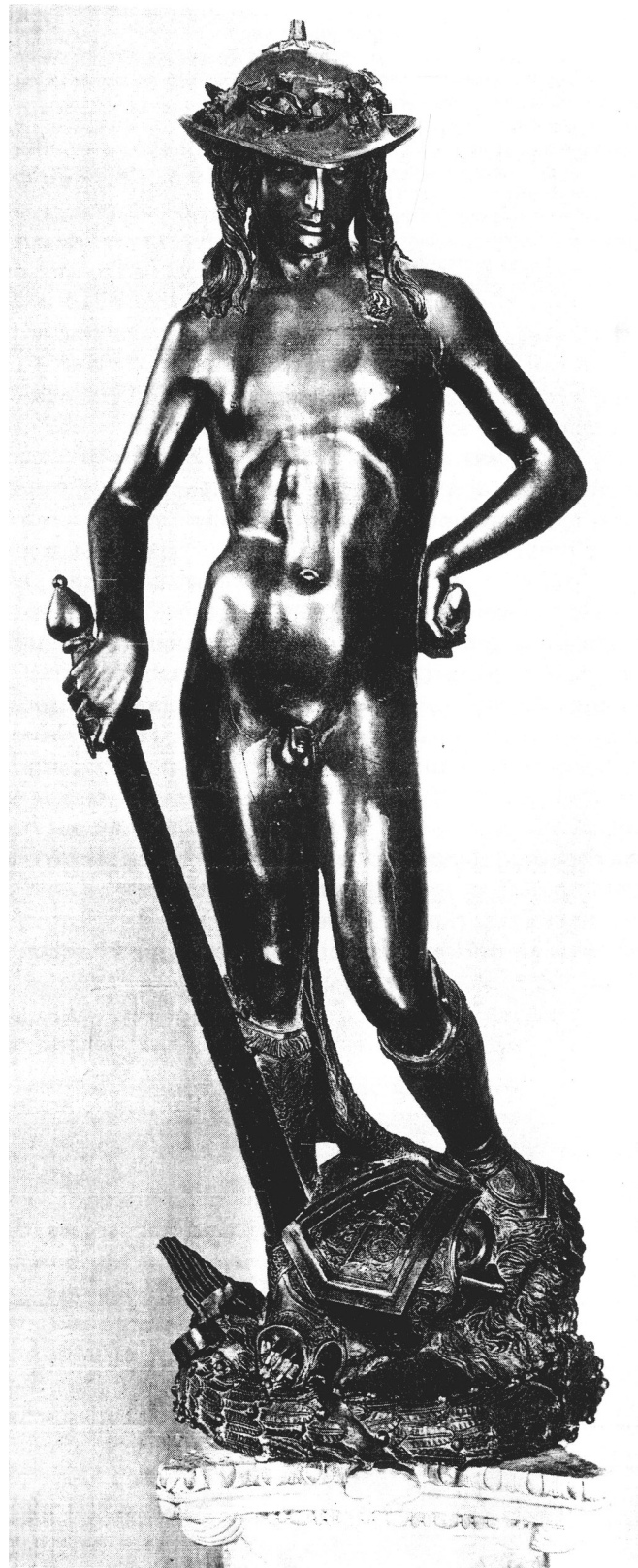
Figure 5. Donatello, David , (Florence, entre 1428 et 1430).