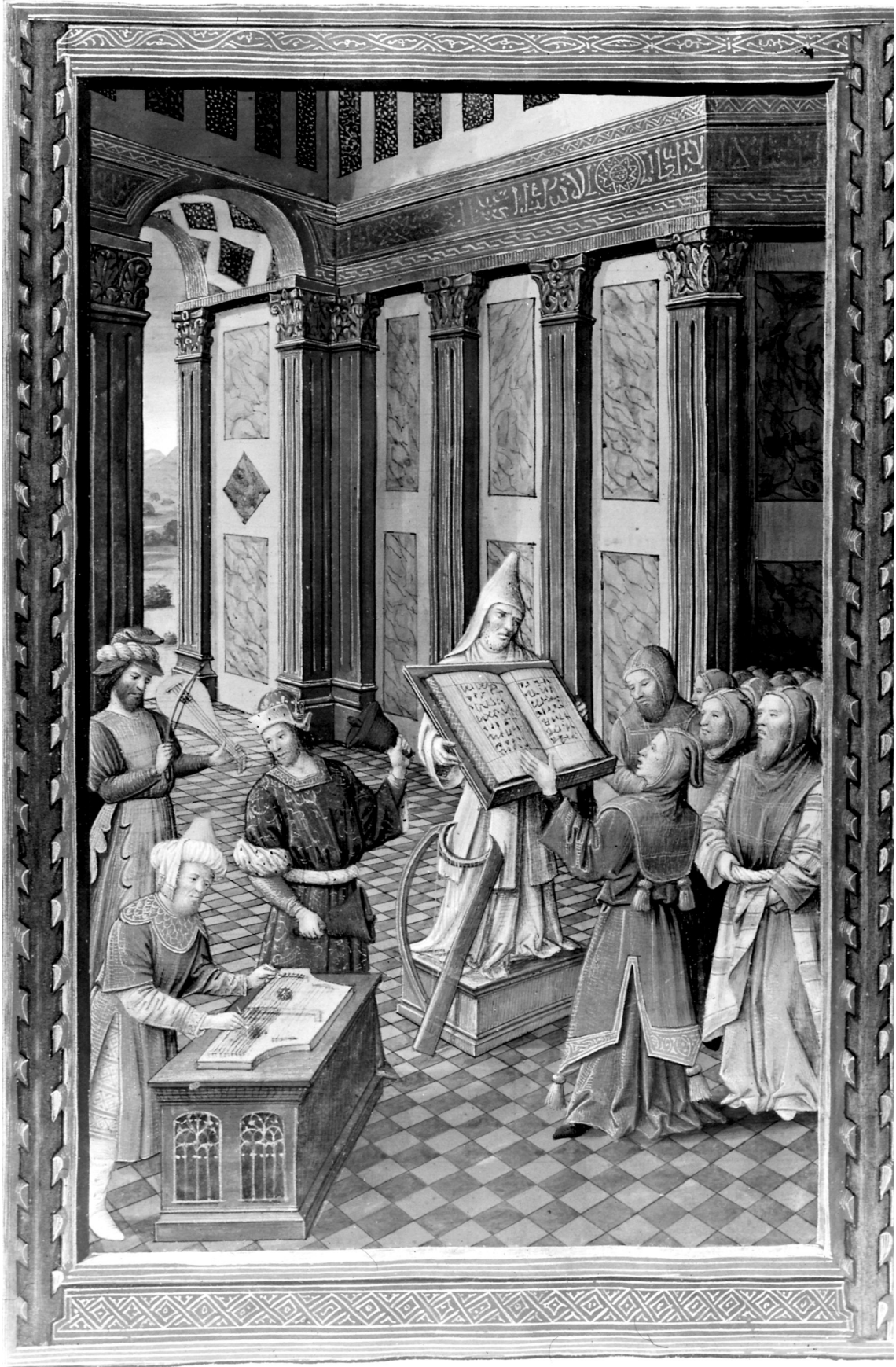
Figure 4. BnF, ms. lat. 10491, fol. 154v Diurnal de René II de Lorraine , ps. 51.