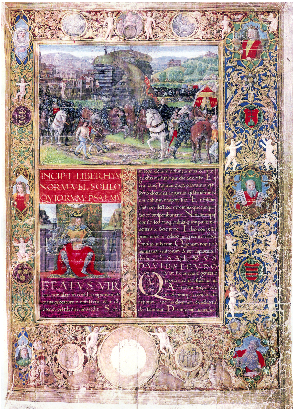
Figure 7. Bibliothèque Laurentienne, ms. Plut. 15, cod. 17, fol. 2r Biblia (Florence, 1489-90).