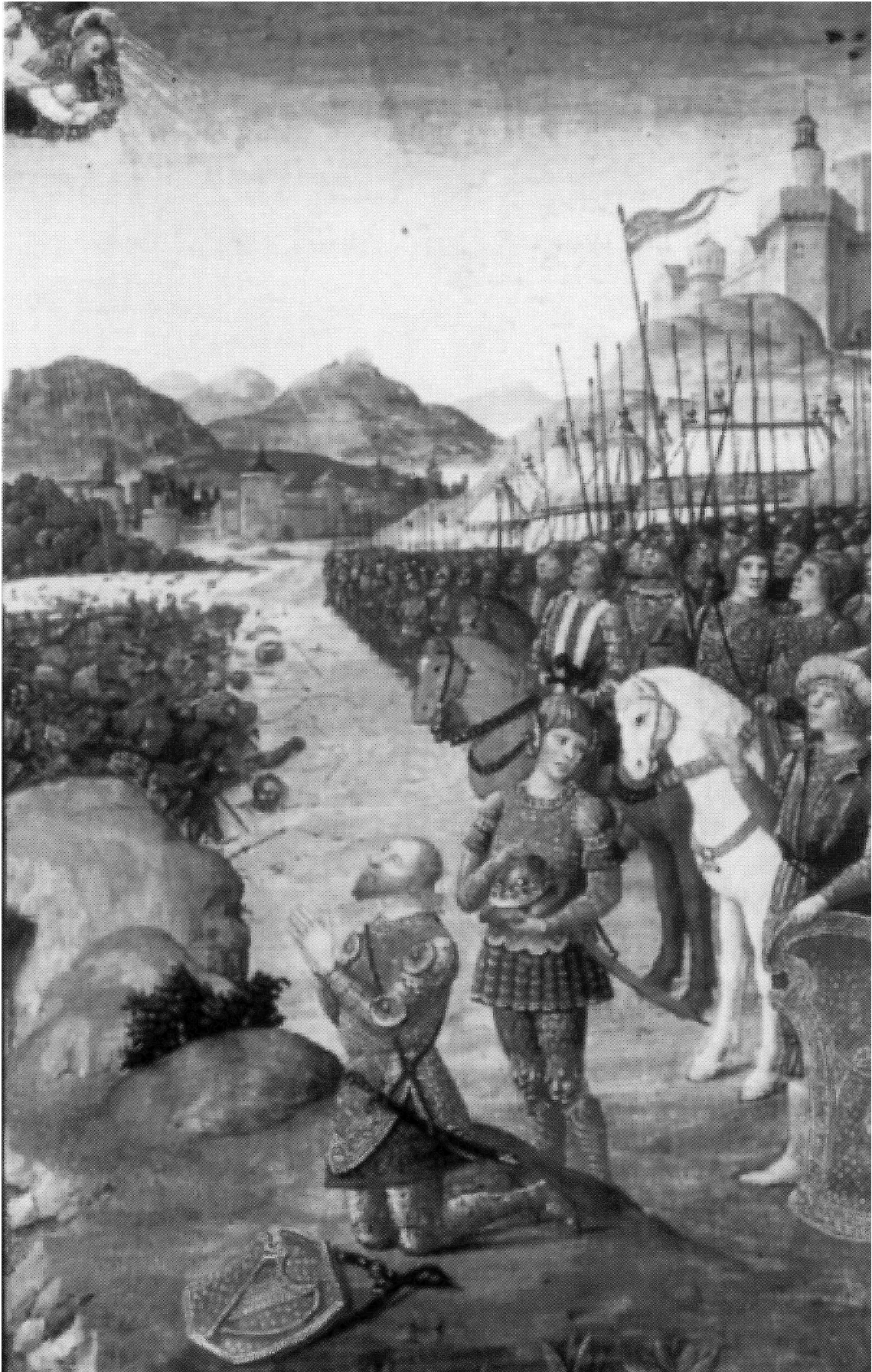
Figure 2. BnF ms. lat. 10491, fol. 147v Diurnal de René II de Lorraine (1492 et 1494), ps. 26.