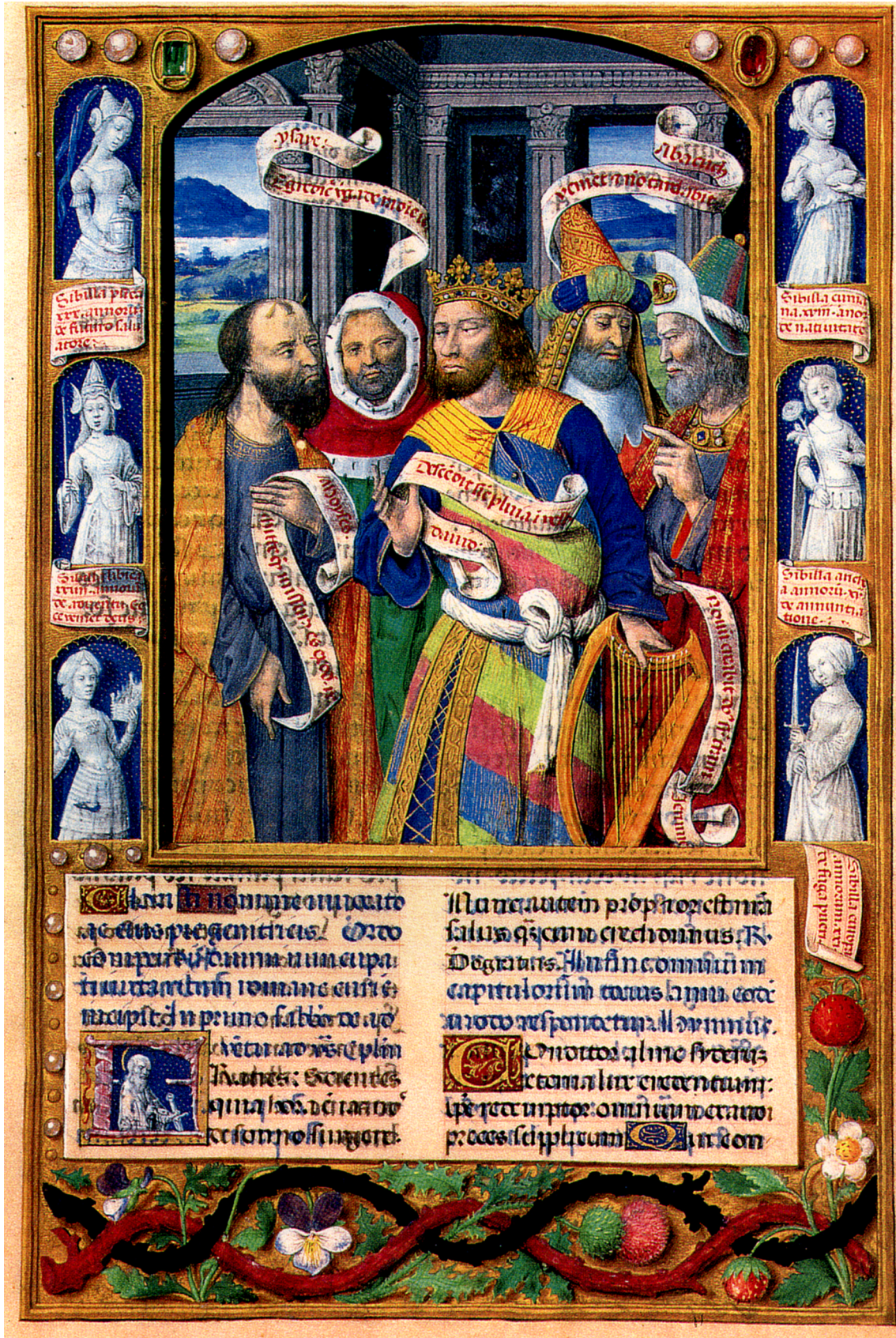
Figure 3. BnF ms. lat. 10491, fol. 7r Diurnal de René II de Lorraine.