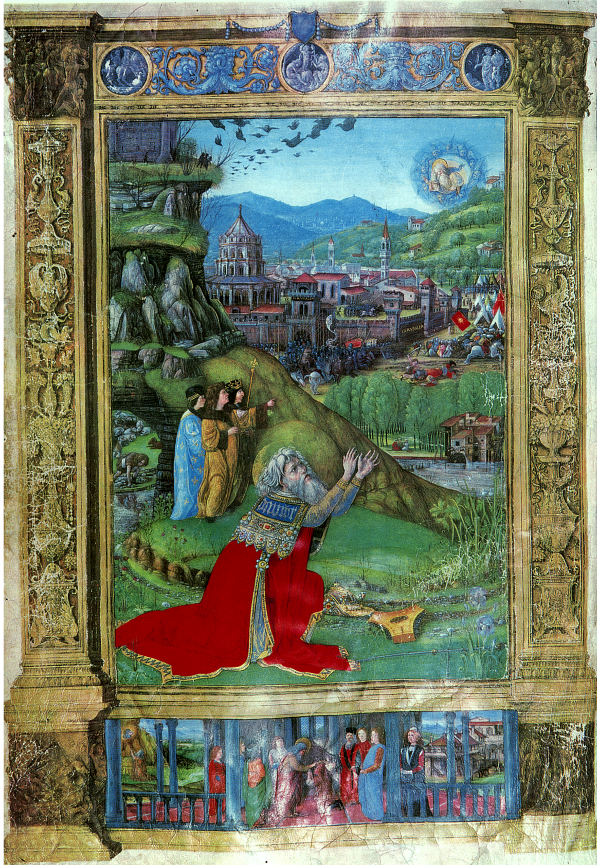
Figure 6. Bibliothèque Laurentienne, ms. Plut. 15, cod. 17, fol. 1v Biblia (Florence, 1489-90).