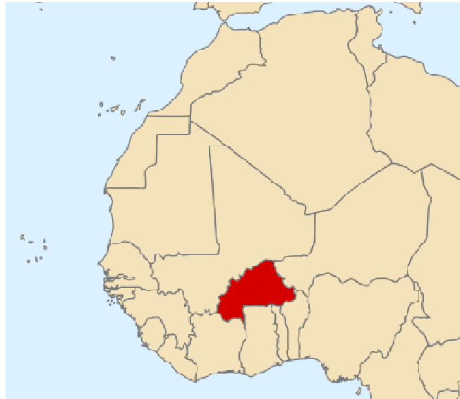
Figure 2 - Localisation du Burkina Faso en Afrique de l'Ouest