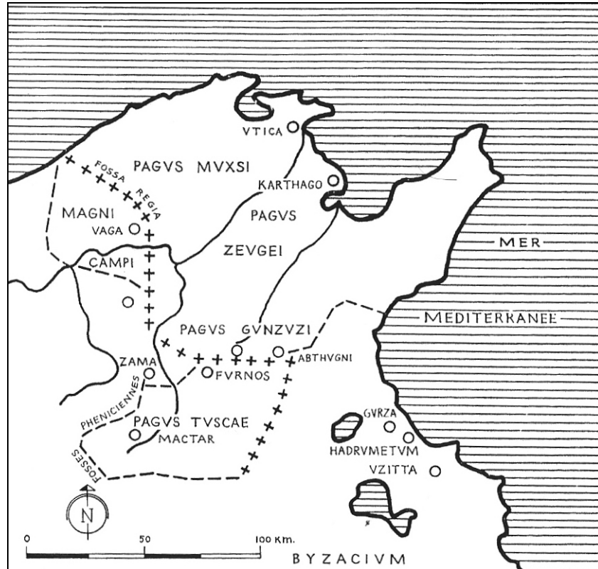
Fig. n° 4 – Division administrative du territoire carthaginois.

cinq premières circonscriptions révélées par les textes, G.-Ch. PICARD propose d'ajouter celles de Byzacène 16 et de la région des Grandes Plaines 17 (fig. n° 4) et S. AOUNALLAH celle de Cap Bon, 18 qui présentent chacune des cohérences historiques et géographiques.