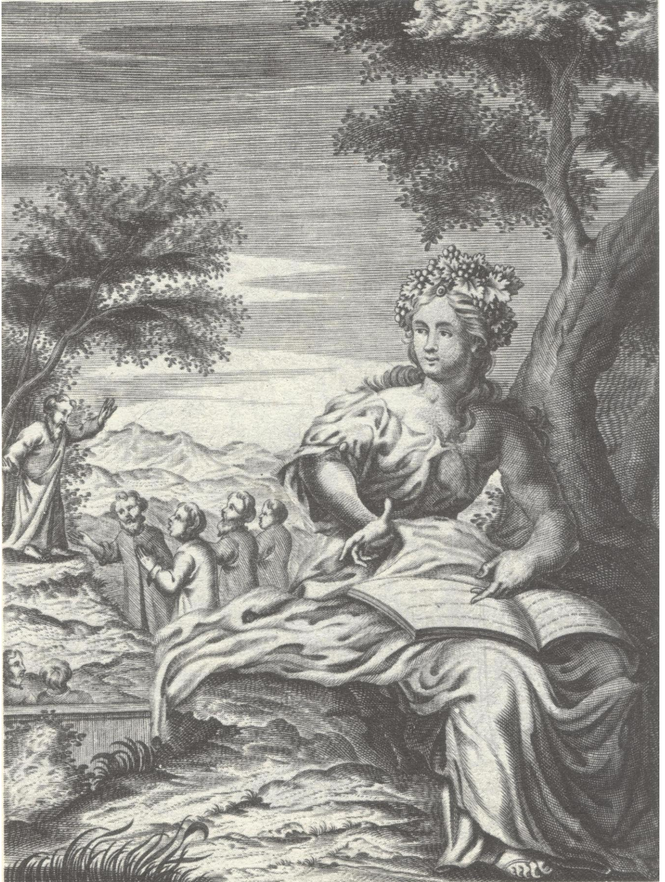
Planche de l'édition des Obras de don Francisco de Quevedo, Amberes, viuda de Henrico Verdussen, 1726, reproduite dans Poemas escogidos de José Manuel Blecua (Madrid, Editorial Castalia, Clásicos Castalia, 1989, p. 98).