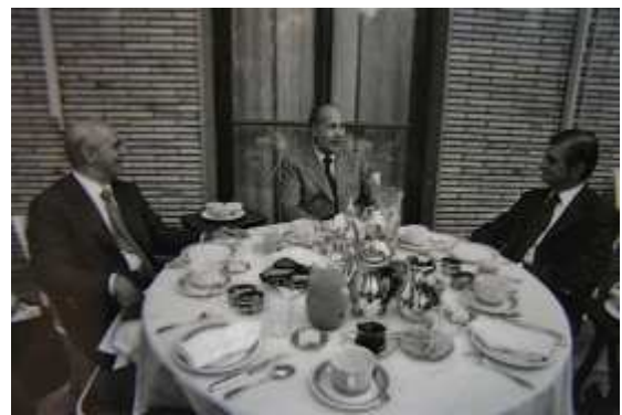
A gauche : Henry Kissinger, Valéry Giscard d'Estaing et Gerald Ford à l'ambassade des Etats-Unis. Helsinki, 1 er août 1975. A droite : Avec le premier ministre grec Constantin Caramanlis (à gauche de la photo), le même jour.