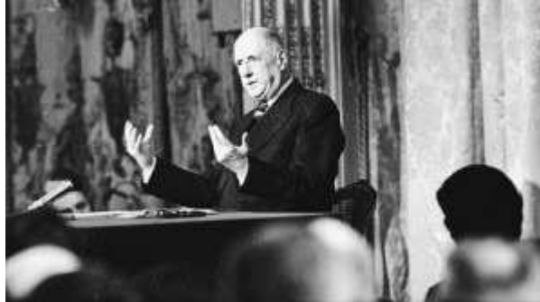
Conférence de presse du général de Gaulle, 4 février 1965.