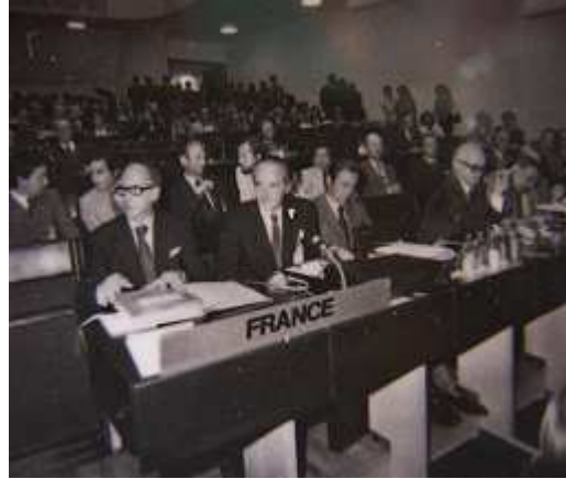
A gauche : Valéry Giscard d'Estaing lors de la troisième phase de la CSCE à Helsinki, 31 juillet 1975. A droite : à Helsinki avec Jean Sauvagnargues.