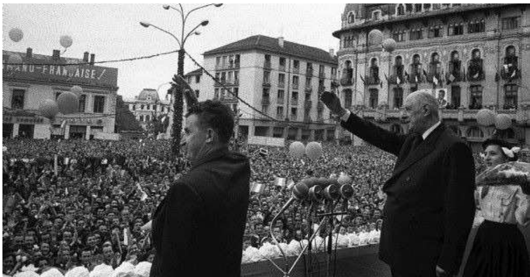
Charles de Gaulle en compagnie de Nicolae Ceausescu en Roumanie, 17 mai 1968.