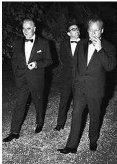
Georges Pompidou et Willy Brandt près de Cologne, 1972.