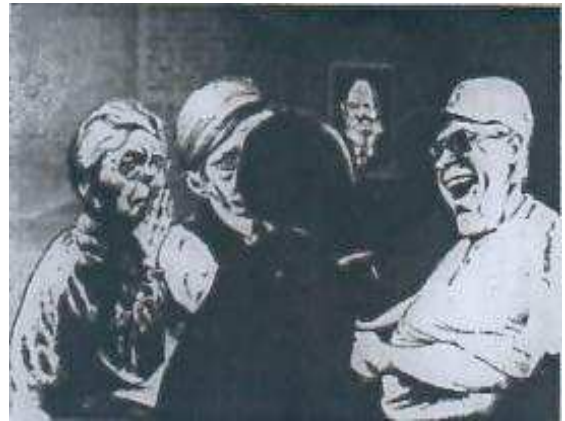
Le Figaro , 1 er août 1975. Image de droite : Wilson, Schmidt, Ford et, le dos tourné, Giscard. Le portrait de Jobert est accroché au mur. Légende : « Si on ne peut même plus tricher entre amis » ( Marius, Marcel Pagnol ).