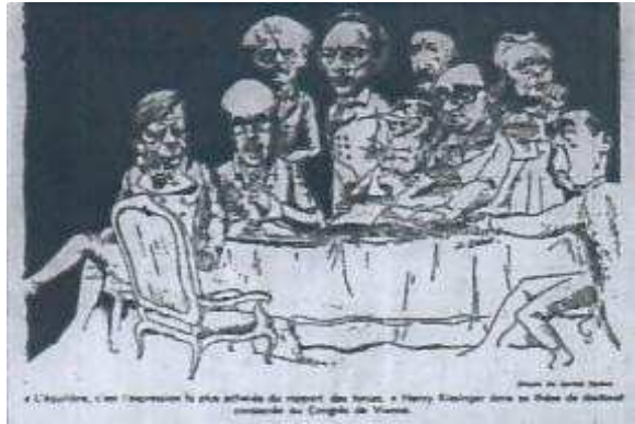
Caricatures parues dans Le Figaro du 30 juillet 1975. A gauche, on reconnaît Giscard, Ford et Brejnev. Légende de l'image de droite : « L'équilibre, c'est l'expression la plus achevée du rapport des forces ». Henry Kissinger dans sa thèse de doctorat consacrée au Congrès de Vienne ». Cette caricature du Congrès de Vienne représente, assis autour de la table, Helmut Schmidt, Valéry Giscard d'Estaing, Gerald Ford et Leonid Brejnev. Kissinger est debout entre les deux derniers. Harold Wilson est derrière lui.