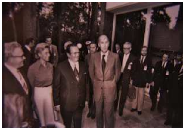
A gauche : Giscard et Sauvagnargues reçoivent, à l'ambassade de France à Helsinki, la délégation polonaise conduite par Edward Gierek le 31 juillet 1975. A droite : Giscard en compagnie du maréchal Tito à Helsinki, le même jour.