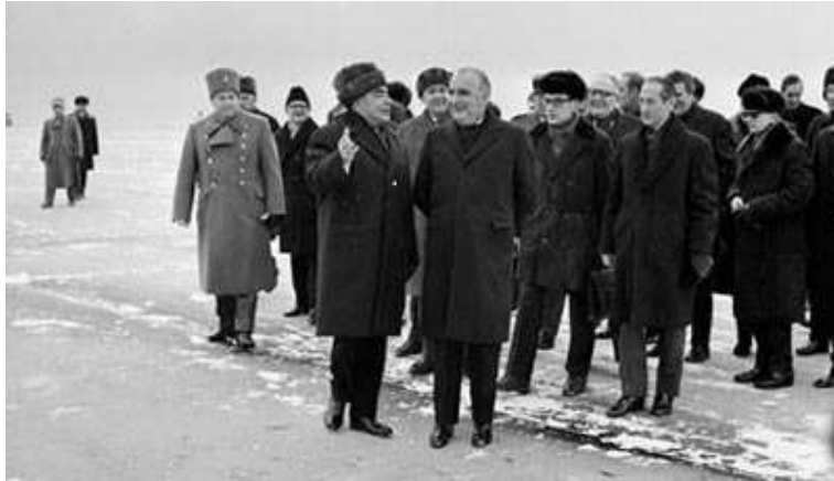
Georges Pompidou et Leonid Brejnev à Zaslavl, janvier 1973.