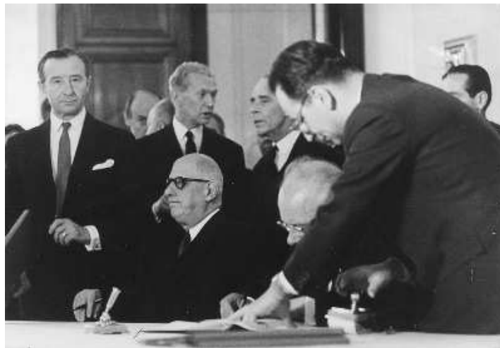
Charles de Gaulle en URSS, juin 1966.