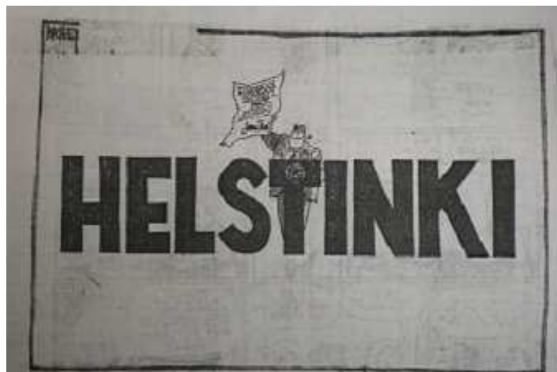
Caricature de Gerald Ford brandissant l'Acte final avec sa signature. To stink signifie « puer ».