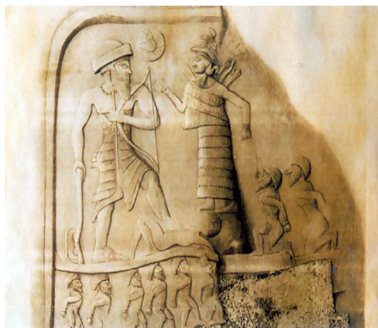
Cf. p. 366 Bas-relief d'Annubanini, roi des Lullubi. Sculpté sur le rocher (la fin du III e millénaire avant Jésus-Christ), à la sortie du village de Sar-é Pol-é Zahab, le bas-relief représente le roi Lullubi, à long barbe carrée, la tête couverte d'un bonnet rond, habillé d'un court vêtement et armé d'un arc et d'une sorte de harpe-luth, et qui pose son pied sur un ennemi étendu à terre. La déesse Ninni par une main lui tend l'anneau du pouvoir royal et par l'autre elle tient le bout d'une corde qui lie deux prisonniers nus et ligotés. Louis Vanden Berghe, Archéologie de l'Iran ancien , p.101.