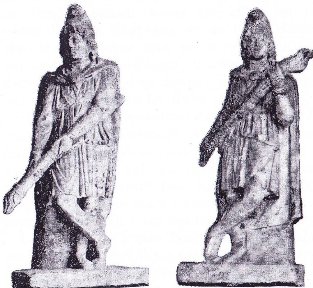
Cf. p. 432 Statues de Cautès et Cautopatès (dadophores) au Musée de Palerme. Franz Cumont, Les Mystères de Mithra , p. 131.