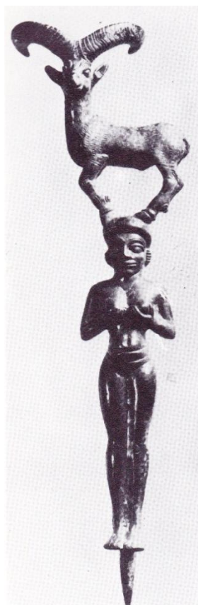
Cf. p. 365 Statuette en bronze de la Déesse-mère (Anâhitâ) au bouquetin, symbole de la fécondité et de la procréation. Luristan, Iran ( Collection M. Foroughi. ). Roman Ghirshman, L'Iran des origines à l'Islam , figure IV (sans pagination).