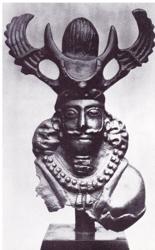
Cf. p. 365 Buste de roi sassanide. Bronze. Musée de Louvre. Roman Ghirshman, L'Iran des origines à l'Islam , figure XVI (sans pagination).