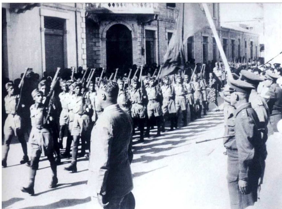
Limassol 1941, Parade de volontaires Chypriotes grecs, membres de l'AKEL - Anorthotikon Komma tou Ergazomenou Laou -, Parti progressiste du Peuple travailleur.