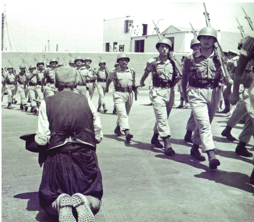
Limassol, le 17 août 1960 : le débarquement des troupes grecques.

souveraineté et à la fondation de la République de Chypre, les armées grecque et turque débarquent à Limassol.