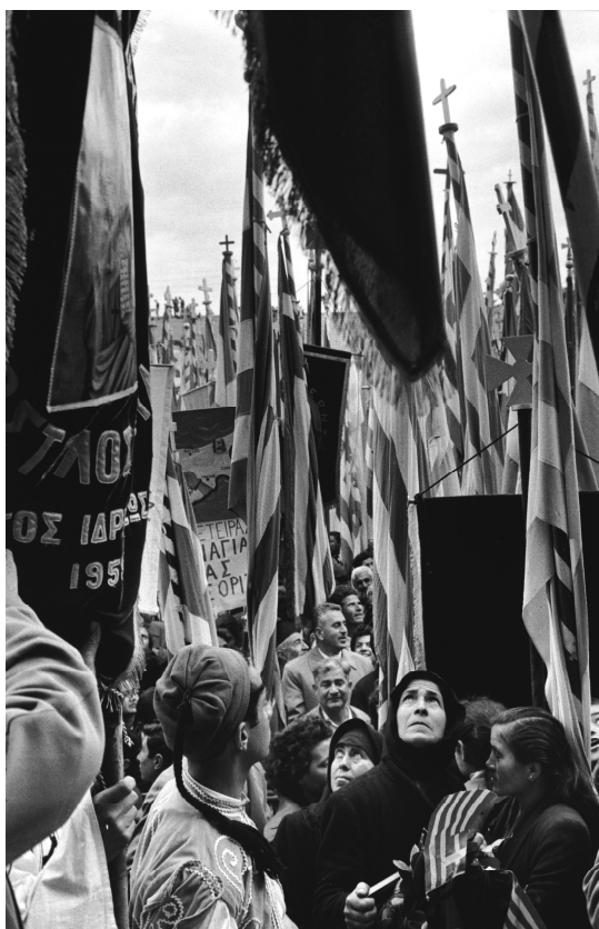
Nicosie le 1er mars 1959, le retour de Makarios.