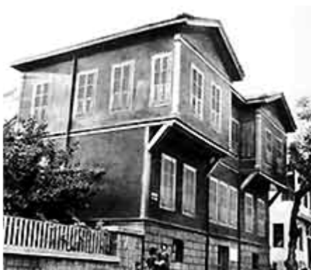
Maison d'Atatürk à Thessalonique.

d'Istanbul sont saccagées et plusieurs églises sont vandalisées (Weston Markides, 426). La cause de ces manifestations de violence est la rumeur concernant l'explosion d'une bombe au Consulat turc à Thessalonique, maison natale d'Atatürk que nous pouvons voir sur cette photographie. Cette explosion n'a jamais eu lieu mais elle a suffi à embraser les esprits de certains Turcs contre les Grecs d'Istanbul. Cette rumeur a été, en fait, déclenchée par le gouvernement turc pour mobiliser l'opinion publique turque (Hatzivassiliou, 1991, 145). Le supposé poseur de bombe serait un certain Octay Engin, membre de la communauté musulmane de Thrace, qui aurait agi sur instructions du gouvernement turc qui cherchait à renforcer sa position face au gouvernement grec pendant la conférence à et imposer ainsi un nouveau rapport de force. Adnan Menderes, Premier ministre turc 289 , et Fatin Zorlu, son ministre des Affaires étrangères, seront jugés pour ces faits après le coup d'État de 1960 (Weiker in Hatzivassiliou, 1991, 149).