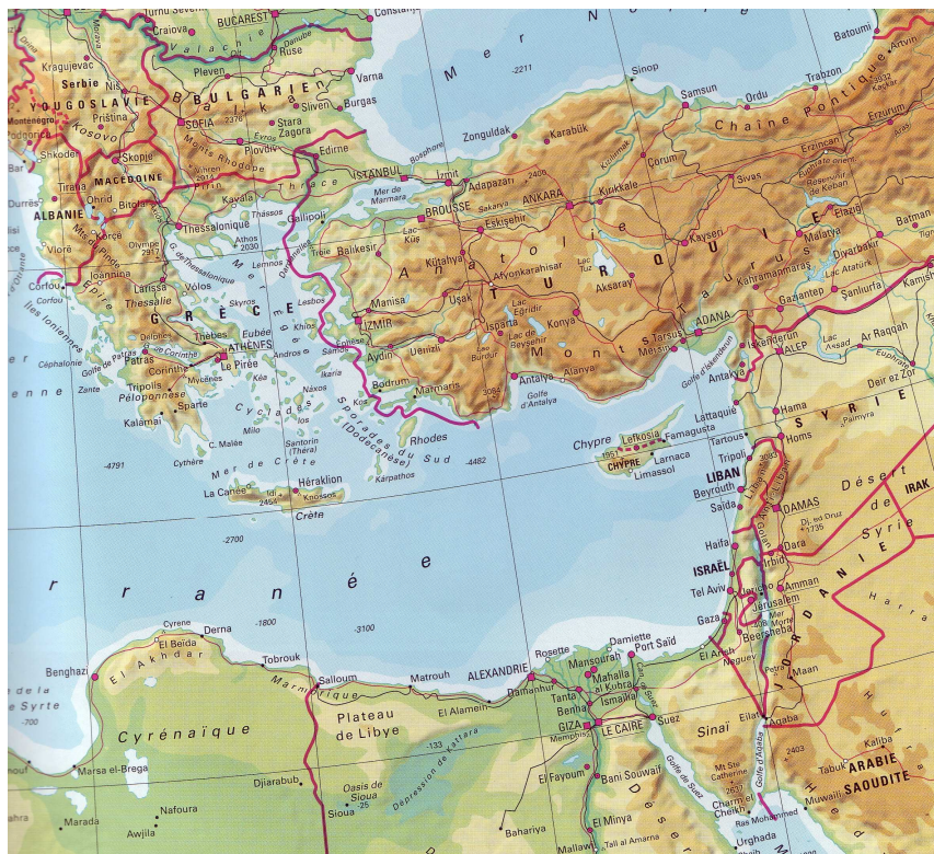
L'Est méditerranéen Source : Atlas du 21 e siècle.

Chypre, Kıbrıs en turc et Κύπρος en grec, tient son nom du latin Cyprum aes qui signifie bronze de Chypre, est un point de convergence entre trois continents, ce qui lui confère une importance stratégique. Elle a suscité la convoitise de nombreux empires, soucieux de contrôler la région et de s'assurer un passage vers des pays lointains. Avec une superficie de 9 251 km 2 , c'est la troisième plus grande île de la Méditerranée après la Sicile et la Sardaigne. Comme nous pouvons le voir sur la carte, Chypre est située à l'Est du bassin méditerranéen, à 300 kilomètres de l'Égypte, à 90 kilomètres à l'ouest de la Syrie et à 60 kilomètres au sud de la Turquie. La Grèce continentale est située à plus de 500 kilomètres au Nord-Ouest.