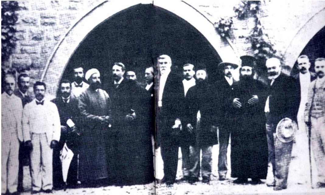
Le Conseil législatif, Nicosie 1902.

l'image se veut-elle un élément de rapprochement ou d'éloignement ? Le Britannique est-il l'élément réunificateur -l'arbitre- autour duquel les musulmans et orthodoxes travailleront ensemble avec les mêmes buts politiques et sociaux ?