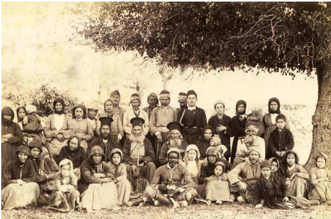
Les habitants du village de Lania, 1878.

pratique courante au sein de l'Empire ottoman. En tant que nécessité économique plutôt qu'aspiration religieuse, elles n'altéreront pas le mode de vie rural ni la coexistence traditionnellement paisible des communautés orthodoxe et musulmane 34 . Paradoxalement, la conquête de Chypre par la Sublime Porte rétablit le contact entre la population de l'île, en totalité chrétienne, et le monde grec qui est soumis, lui aussi, au sultan Selim II (Papadopoulos, 13). L'île est dévastée par la guerre et la disette et, pour la repeupler, le Sultan ordonne le transfert d'habitants ottomans anatoliens issus de la région de Konya, choisis à raison d'un foyer sur dix parmi la population rurale flottante, les indésirables et les artisans (Kolodny, 14). Il semble toutefois que ces ordres ne furent que partiellement exécutés et que le transfert ne concerna que quelques centaines de familles (Kolodny, 14). Cette population de colons anatoliens va constituer, avec les militaires turcs et les membres de l'administration ottomane, la communauté musulmane de Chypre.