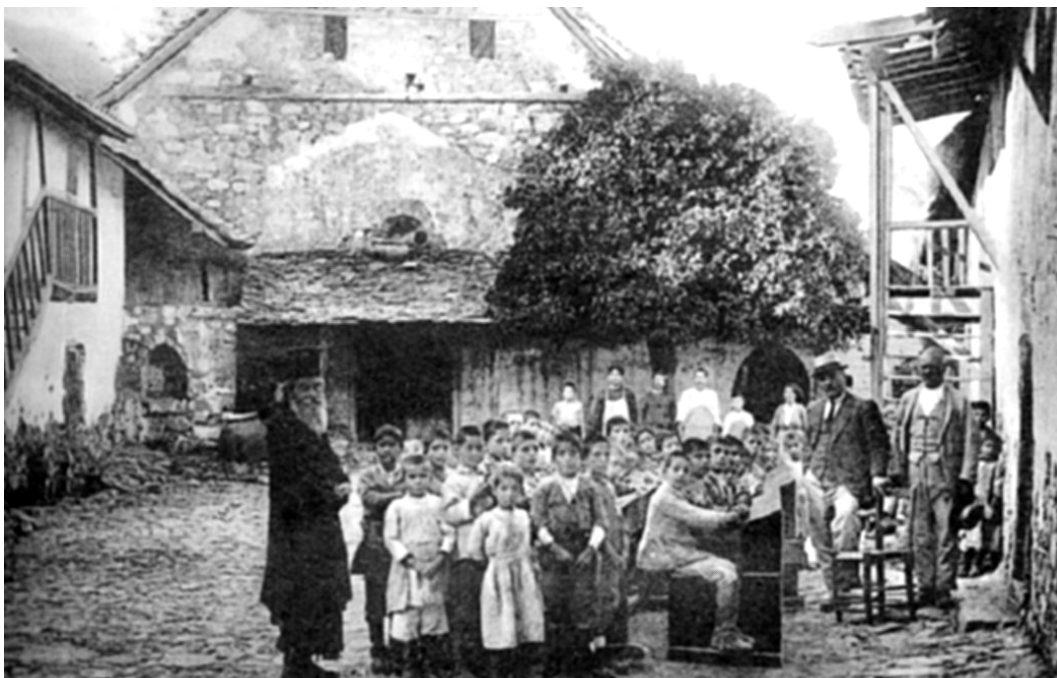
La première école élémentaire au village de Kalopanagiotis. Les leçons sont données dans la cour de l'église.

La photographie ci-dessous illustre l'une des nombreuses écoles en région rurale qui disposent de très peu de moyens. A droite de l'image, l'instituteur, à gauche, le prêtre, tous deux responsables d'inculquer l'alphabétisation et l'hellénisation de la mémoire collective. Le matériel scolaire, identique à celui de la Grèce, devient le support de la construction de l'identité chypriote grecque.