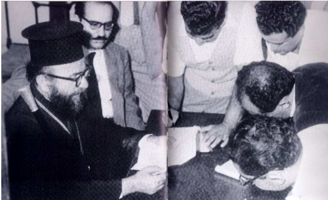
Le plébiscite. Janvier 1950.

Le plébiscite a lieu dans toutes les églises de Chypre les dimanches 15 et 22 janvier 1950. Toutes les personnes âgées de plus de seize ans ont le droit de participer au vote. Les femmes votent pour la première fois et ce n'est pas anodin. En effet, il ne s'agit pas d'un acte d'émancipation politique, mais les femmes étant plus proches de l'Église, elles représentent pour cette dernière un électorat acquis à sa cause. Le choix présenté aux Chypriotes est le suivant : « Nous demandons l'union avec la Grèce » ou « Nous, nous opposons à l'union de Chypre avec la Grèce » ( Cyprus Mail 06/12/1949 in Crawshaw, 49). Le résultat du plébiscite est annoncé le 27 janvier par l'Ethnarchie. Les Chypriotes ont massivement voté pour l' Enosis : selon l'Ethnarchie, 215 108 sur 244 747 votants, soit 95,7%, se sont déclarés en faveur de l'union avec la Grèce. Le résultat de ce vote prendra toute son ampleur avec l'arrivée, à la tête de l'Église, de Makarios III 210 , nouvel archevêque qui saura largement en exploiter les conséquences. Michalis Mouskos, connu sous son nom archiépiscopal de Makarios, est élu à la tête de l'Église le 29 octobre 1950, suite à la mort de Makarios II en juin de la même année. Dès son retour à Chypre en 1948, à la fin de ses études théologiques à Athènes, puis à Boston, aux États-Unis, il devient évêque de Kition, l'actuelle ville de Larnaca. Makarios III est le plus jeune