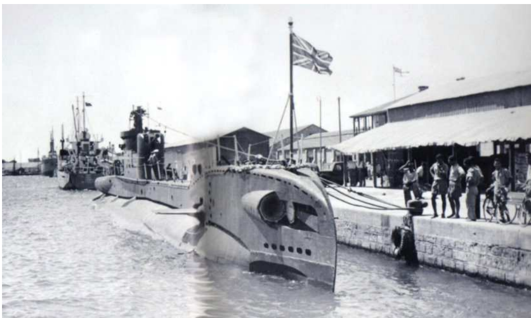
Sous-marin et autres bateaux de guerre britanniques dans le port de Famagouste, Juillet 1950.

que sa déclaration relève de la propagande coloniale. 219 Grâce aux subventions britanniques, l'administration coloniale a pu maintenir l'équilibre du budget et, ainsi, éviter l'augmentation des taxes, source de conflit. Elle a certes amélioré les conditions de vie des habitants, surtout dans les régions rurales, mais sa vraie motivation est d'ordre stratégique. Il lui faut améliorer les infrastructures et élever le niveau de vie de Chypre pour qu'elle puisse devenir une alternative sérieuse à la base militaire de Suez. Les bases de Dhekelia et d'Akrotiri commencent à prendre forme et des unités de combat stationnent à Chypre en vue de leur transfert en Égypte.