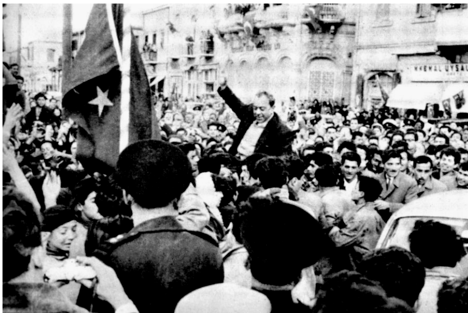
Fazil Küçük à son retour d'Ankara, Nicosie le 7 mars 1959.

Le 7 mars 1959, Küçük et la délégation chypriote turque, de retour d'Ankara, reçoivent, une semaine après Makarios, le même type d'accueil chaleureux avec une reconnaissance, cette fois-ci, envers la Turquie. Chaque communauté honore séparément les accords de Londres.