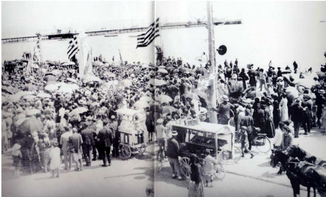
Port de Famagouste, visite du secrétaire d'État Winston Churchill le 9 octobre 1907.