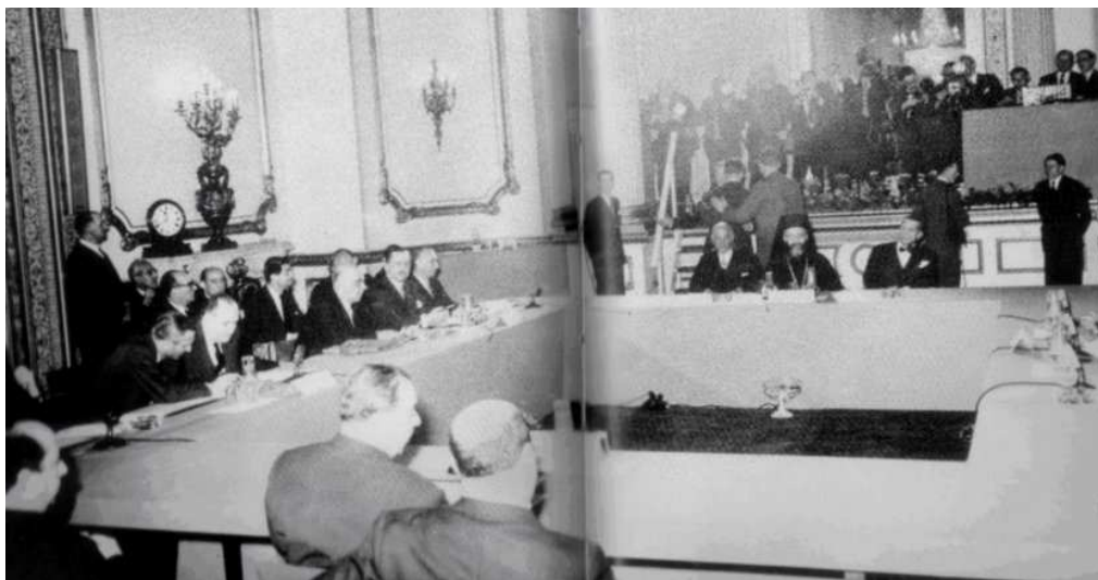
La Conférence à Lancaster House, 19 février 1959.