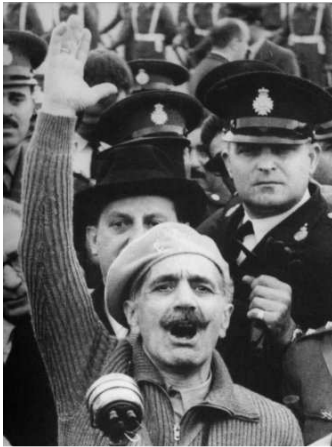
Gheorghios Grivas, à son retour à Athènes le 19 mars 1959.