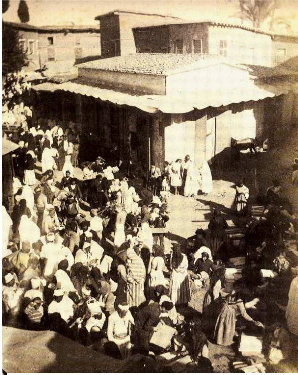
Le Bazar de Nicosie, 1878 Source Cyprus of J. P. Foscolo , © Cultural Center Cyprus Popular Bank.

Jusqu'à l'arrivée des Britanniques, et malgré ces événements marquants, la