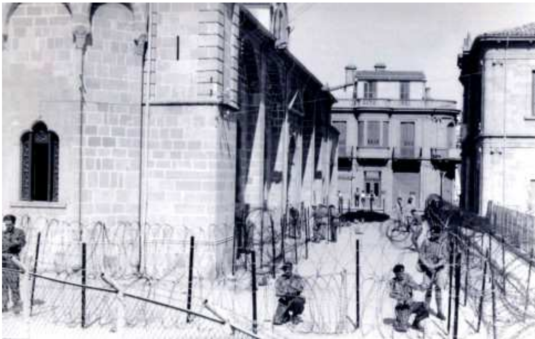
La Mason-Dixon Line tracée avec des barbelés par des soldats britanniques, juin 1958.

à une action contre les Turcs » 329 . La Turquie maintient la pression et Londres ne veut pas compromettre le soutien turc en protégeant des civils chypriotes grecs. La situation, créée par la politique britannique, à ce moment-là, échappe à tout contrôle. Finalement, pour éviter les affrontements, l'administration coloniale décide de tracer la Mason-Dixon line 330 , séparant ainsi les quartiers chypriotes grec et turc de Nicosie... Les barbelés s'installent durablement dans le paysage chypriote.