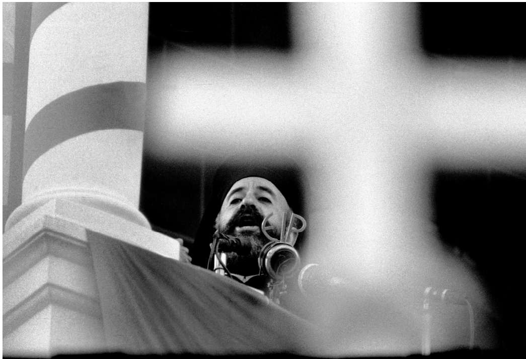
Makarios à son retour à Chypre en mars 1959.

archevêque dans l'histoire de l'Église de Chypre. Personnalité charismatique et grand orateur, il s'engage publiquement, lors de son élection au siège archiépiscopal, à « ne jamais renoncer à [la] politique de l'annexion de Chypre par la Grèce » ( Eleftheria , 21/10/1950). Un engagement diachronique. Makarios, présenté sur cette photographie lors d'un discours dans l'église de Phaneromeni à Nicosie, personnifie le pouvoir à la fois temporel et religieux.