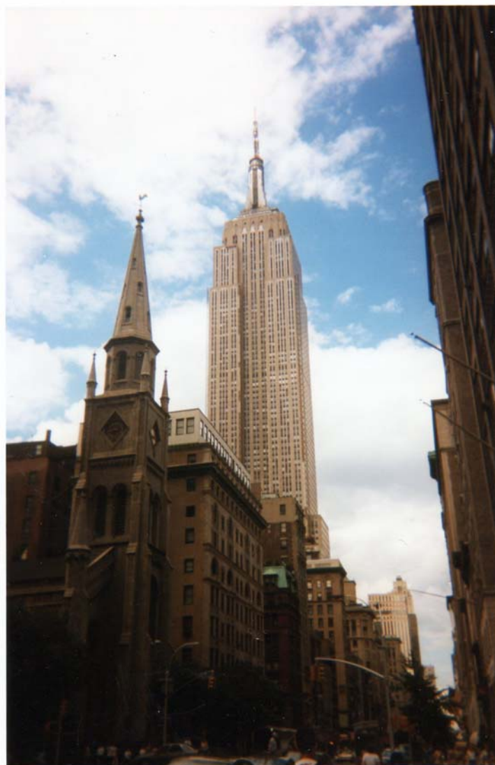
Empire State Building.