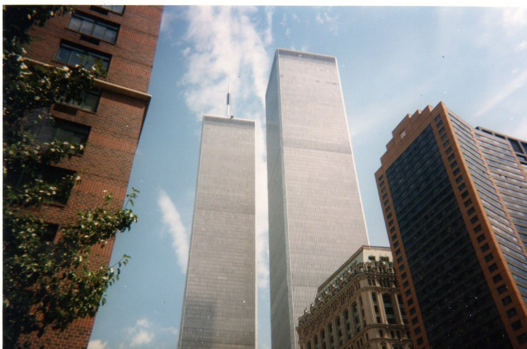
Les tours jumelles du World Trade Center.