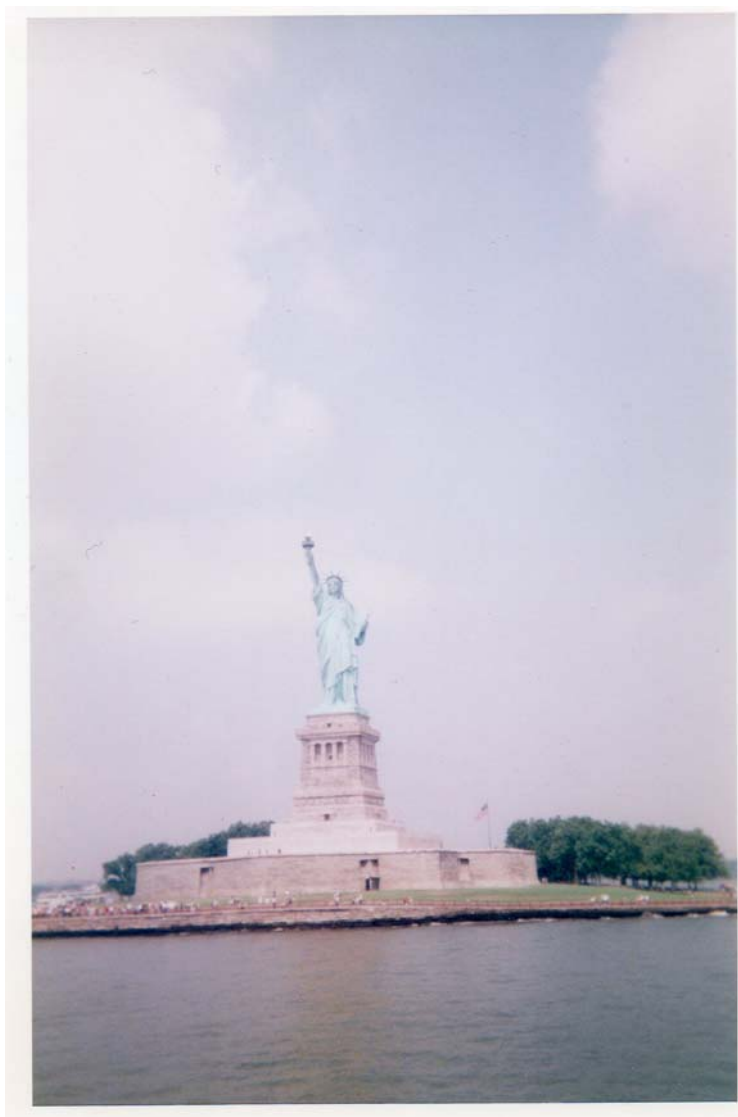
La statue de la Liberté.