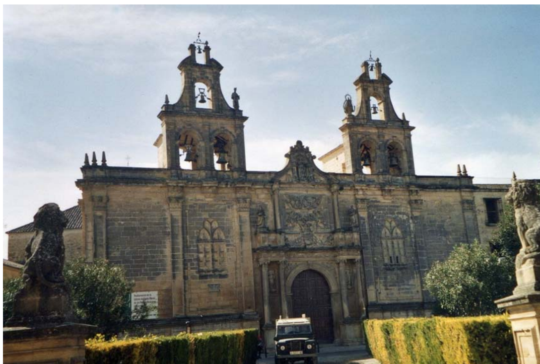
Campaniles de l'église Santa María de los Reales Alcázares, Úbeda.