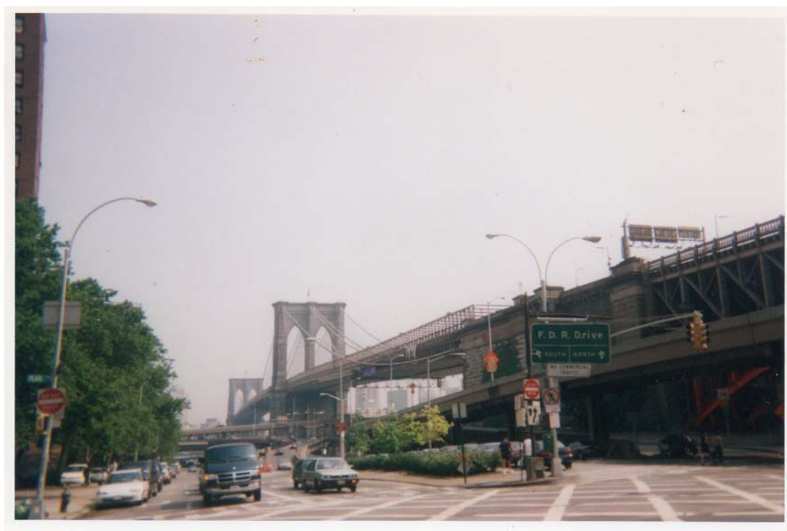
Le pont de Brooklyn.