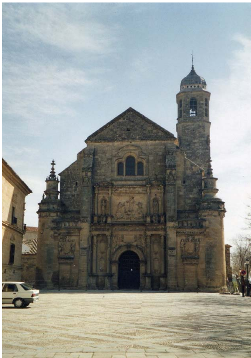
Sacra capilla del Salvador, Úbeda.