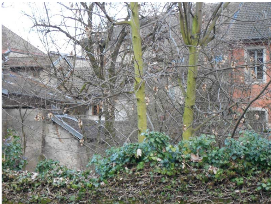
La cour campagnarde, boulevard de Bonivard, Seyssel.