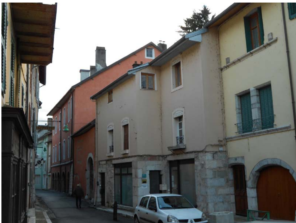
Emplacement de l'ancien hôtel du Commerce, Seyssel, 2012.