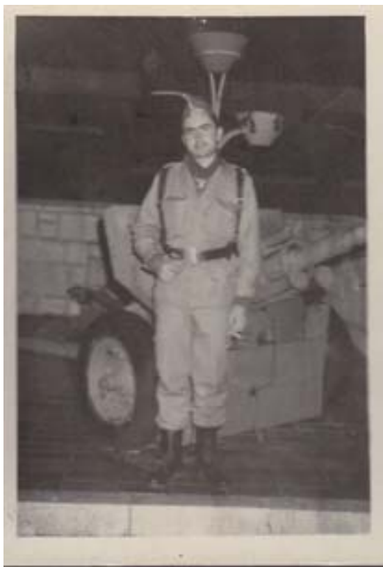
Vitoria, 1979 489 .