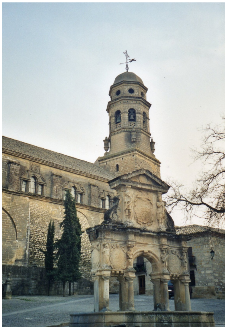
Eglise Santa María de los Reales Alcázares, Úbeda.