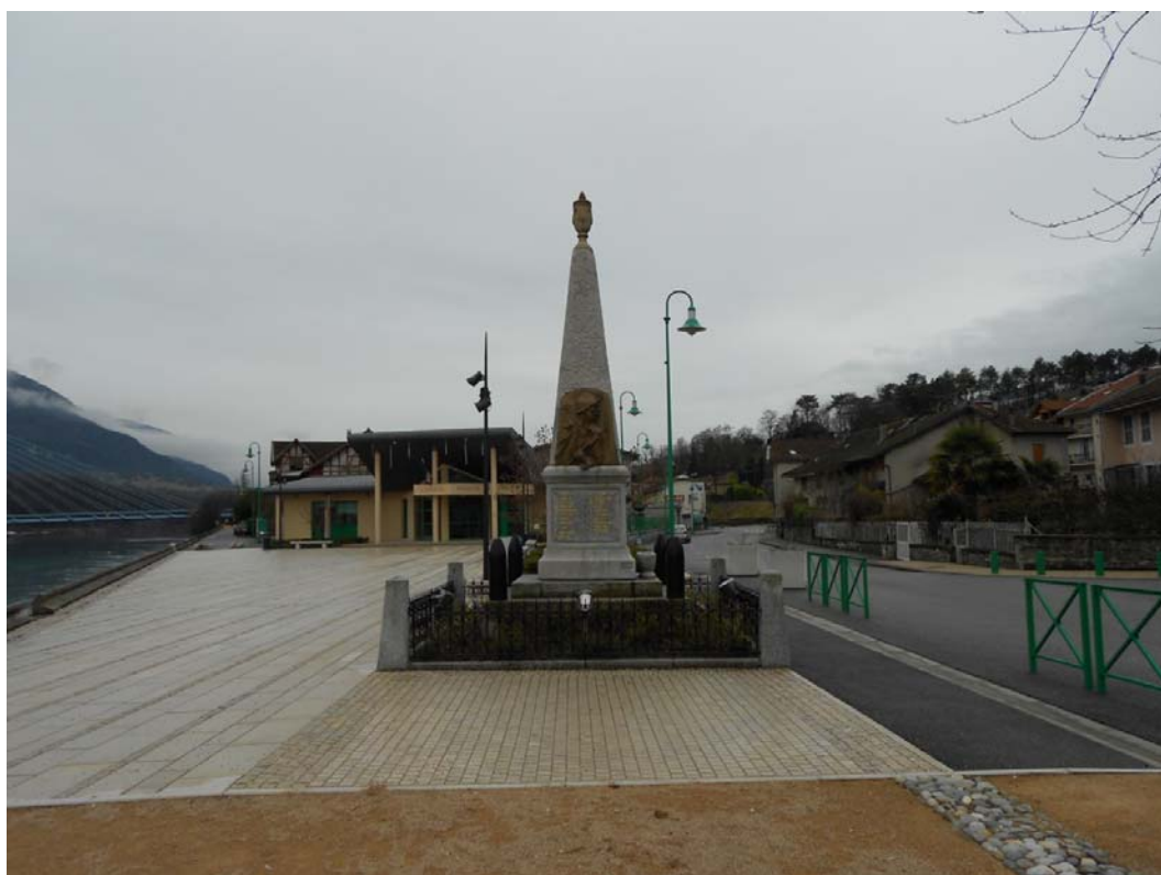
Le monument aux morts de la guerre de 1914, Seyssel.