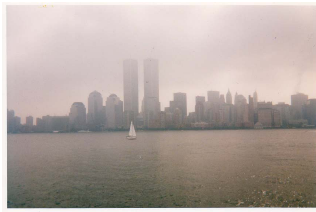
Vue générale de Manhattan.