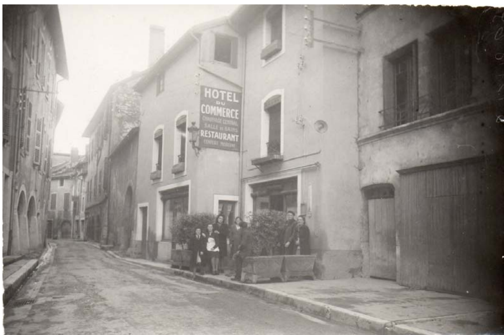
Hôtel du Commerce, Seyssel, 1943.