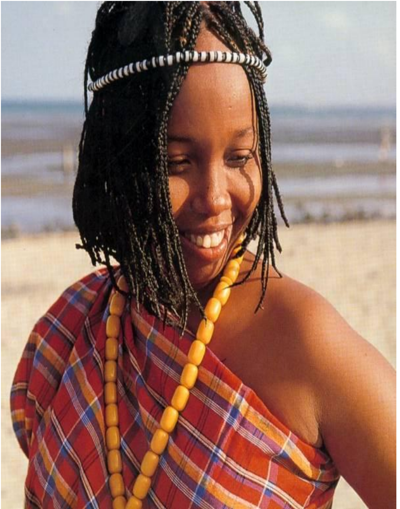
Jeune fille somalie en tenue traditionnelle.