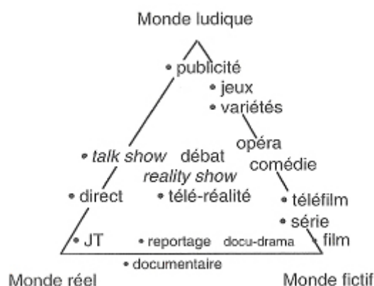
Figure 1 : Mondes du premier degré selon François Jost.

Signalons enfin, pour être plus complet, que les genres évoqués : documentaires, jeux, séries,... sont des genres « pré-existants » à la télévision, mais que ces genres se voient copiés, imités par de nouveaux genres télévisés que François Jost qualifie de genres du second degré, parmi lesquels il place les parodies, la télévision réflexive ( Arrêt sur images ), ainsi que certains procédés comme la reconstitution 66 .