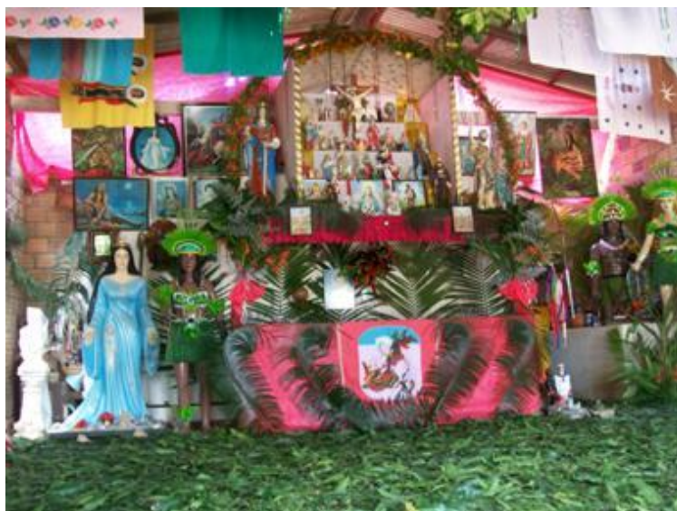
« Salão » Tambor de índio ou Pajelança de José Pajezinho - Carutapera

« a) os tradicionais, que perpetuam exclusivamente a tradição das divindades africanas, que mantêm um repertório de cantos em idiomas africanos e que funcionam segundo um sistema ritual extremamente rígido e complexo. Assim, posso referir-me indistintamente ao xangô do Recife, ao candomblé da Bahia, ao batuque de Porto Alegre e ao tambor de Mina de São Luís ; b) os cultos que introduzem entidades várias, além dos orixás, tais como caboclos, mestres, exus, pretos-velhos, pombagiras. Os cantos são predominantemente em português e as distinções entre os vários estilos rituais não são muito claras. Aqui entram, pois, a umbanda (praticada de norte a sul do país), a macumba (antes característica dos cultos cariocas e paulistas e agora pouco distinta da umbanda), a jurema no Recife, o candomblé-de-caboclo em Salvador, a pajelança ou cura em São Luís e em Belém, a quimbanda em Porto Alegre ».