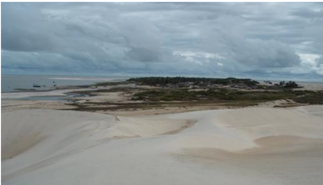
Vue du village – île de Lençóis