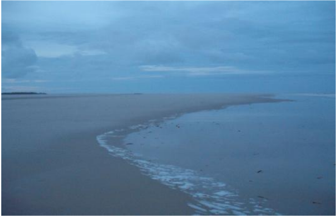
« Demeure » d'en bas du roi dom Sebastião – île de Lençóis

Le littoral de Cururupu était important pour le flux migratoire officiel venu de l'Afrique, mais aussi parce ce qu'il était un point de débarquement de la main-d'œuvre négrière issue aussi de la contrebande 733 , même après son extinction par la loi Eusébio de Queirós 734 du 4 septembre 1850, qui interdisait le trafic inter-atlantique d'esclaves. Le croisement des descendants luso-amérindiens avec les Noirs donne origine aux Caboclos qui vont peupler la région, la Baixada Maranhense . À cela, il faut ajouter l'arrivée des insurgés après le mouvement populaire dit de la Balaçada , entre 1839 et 1841, et la formation de Quilombos , repaires pour esclaves en fuite et cachettes pour les Indiens. La fin du trafic négrier et les crises économiques liées au système de monoculture, le coton, marquent la décadence et la chute des grandes propriétés d'exploitation. Par conséquent, Cururupu ainsi