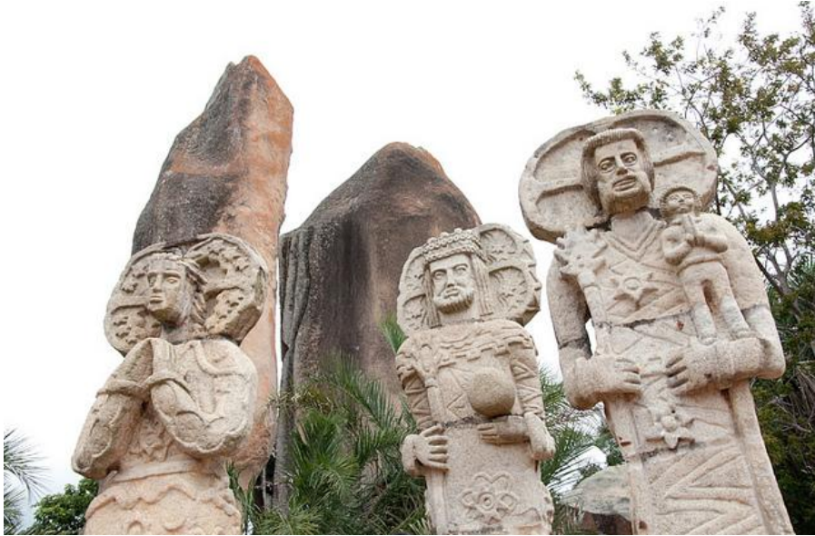
Les deux rochers, lieu du sacrifice, à Pedra Bonita –Pe 333