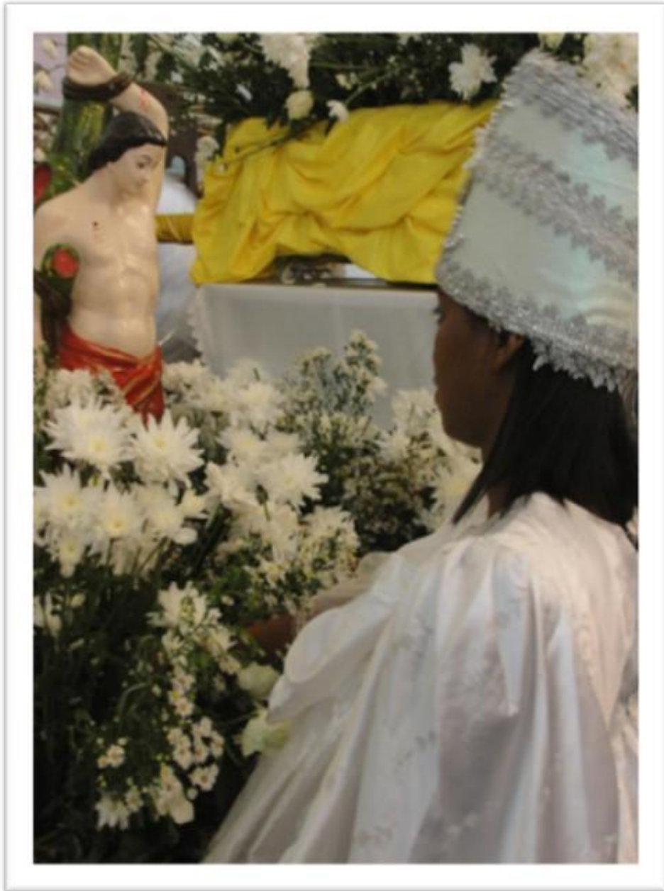
(Procession des Orixás, São Luís - Ma, septembre 2011)

« Le merveilleux est toujours beau, N'importe quel merveilleux est beau, Il n'y a même que le merveilleux qui soit beau »