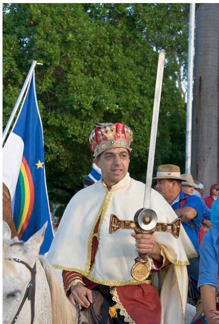
« Cavalgada », le roi dom Sebastião 862