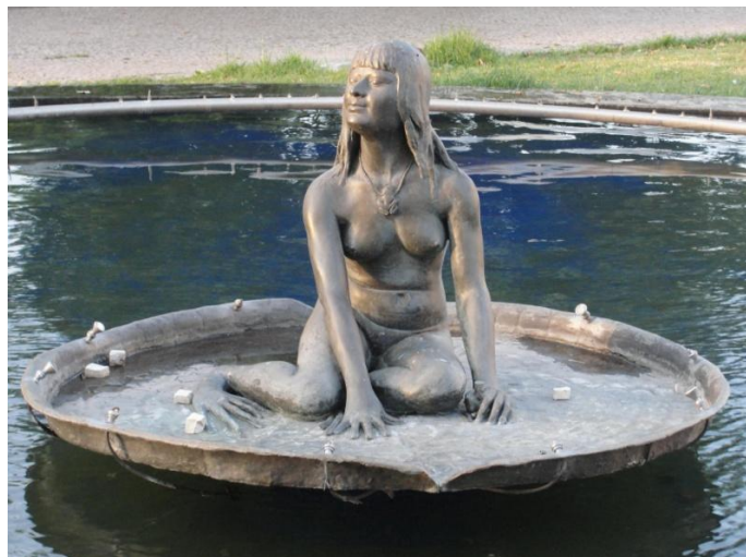
Chafariz da Mãe d'água 671

Il n'est pas dans notre propos d'étudier les origines des entités afro-amérindiennes, qu'il s'agisse des Gentils , des Caboclos ou des Pretos-velhos ainsi que les rites où ils se manifestent et sont vénérés, Tambor de Mina , Candomblé , Batuque , Umbanda , Xangô , Cura ou Pajelança 672 . Nous voudrions relever la topographie des endroits les plus connus comme étant les « demeures » des êtres enchantés, ainsi que la valeur de leurs représentations symboliques aujourd'hui. L'anthropologue Mundicarmo Ferretti s'est intéressée à ce sujet et a publié en 2000, Maranhão Encantado, Encantaria Maranhense e Outras Histórias 673 , où elle réunit plusieurs récits qui lui sont rapportés par des initiés en transe sous l'influence d'un être enchanté. Elle a collecté ses textes dans des terreiros de Tambor de Mina , de Terecô , de Cura/Pajelança et de l'Umbanda . Elle ajoute à la fin de son livre un chapitre intitulé « Outras histórias » qui rapporte des événements vécus dans la capitale de l'État du Maranhão ou à l'intérieur du pays et nombre de ces personnages vivent encore 674 . Mundicarmo Ferretti note que ces histoires font référence à des endroits repérables sur des cartes géographiques ou nautiques mais qu'il y a aussi des endroits qui semblent méconnus telle la forêt, Mata do Gangá , habitat des Surrupiras . Ces endroits, « demeures » d' Encantados , ne sont pas