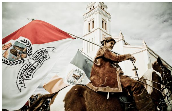
« Cavalgada » en 2011 861

Lors des festivités en mai 2000, parrainées par l'Association culturelle du royaume de Pierre, la cavalcade était composée de plus de 800 cavaliers. À la tête du cortège se trouvait Ariano Suassuna, en tant qu'empereur du royaume de Pierre, et à ses côtés, son fils Dantas Suassuna, en tant que le roi de la cavalcade, accompagné par une reine choisie après concours parmi les jeunes filles de la commune. L'œuvre Romance d'a pedra do reino , est un « romance armorial-popular brasileiro 857 », comme l'indique bien la page liminaire 858 , où l'auteur recrée un monde fictionnel lié aux événements historiques de la région. Le personnage principal Pedro Dinis Quaderna reconstruit à travers la littérature le « royaume » de son grand-père 859 , le roi de la Pedra do reino , et essaye de donner suite au mouvement interrompu tout en narrant ce qui se passe. Par conséquent, les faits ont lieu tandis que l'œuvre s'autoconstruit. À vrai dire, il est difficile de définir Pedra Bonita , car c'est à la fois, un roman, une odyssée, un poème, une épopée, une satyrique, une apocalypse. En somme, c'est un roman tumultueux, d'où s'écoule sang et larmes, doté d'un humour féroce et une acceptation de la fatalité encore plus féroce, comme l'indique dans sa préface, la romancière Rachel de Queiroz (1910-2003) 860 .