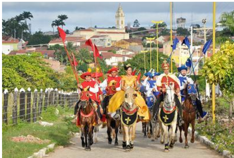
Cavalgada em 2011 de São José do Belmonte - Pe 855

Du mouvement Armorial , il reste aujourd'hui l'esthétique et la Cavalgada de São José do Belmonte , organisée par les habitants de la cité, depuis 1993, pour rendre hommage à la fois au mouvement historique et à l'auteur Ariano Suassuna. Cette cavalcade rappelle le mouvement ordonné par João Ferreira, inspirateur du roman d'Ariano Suassuna.