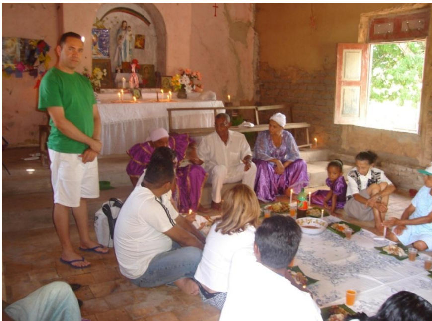
Dimanche de Pâques, déjeuner à la chapelle avant la procession, la litanie et le « toque » en plein ciel Village « spirituel » Nazaré do Bruno, près de Caxias, au Maranhão, avril 2008