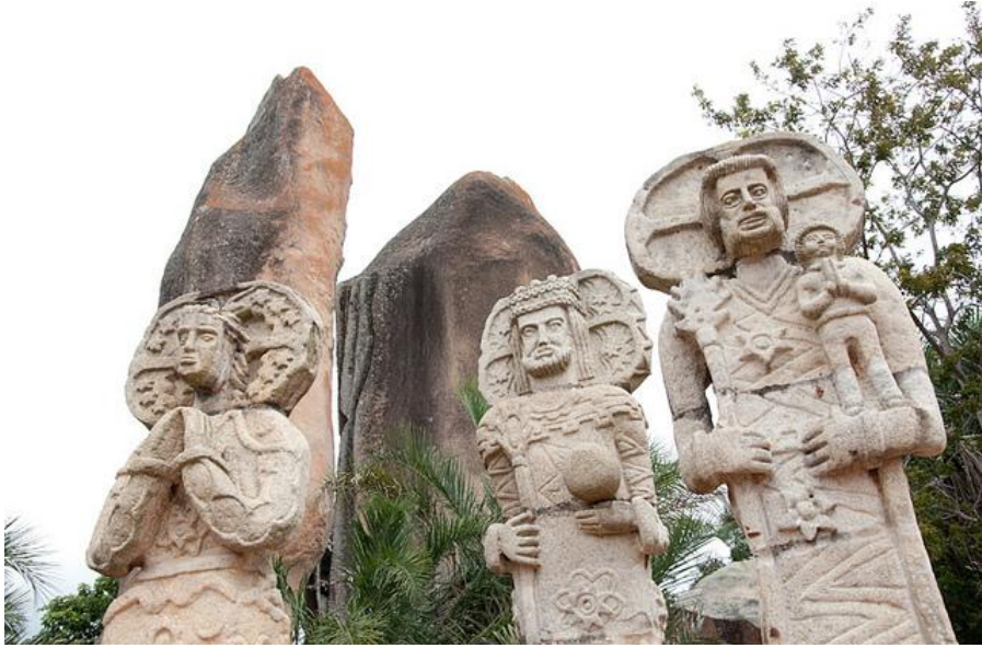
Les deux rochers, lieu du sacrifice, à Pedra Bonita –Pe 333