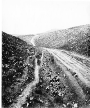
1) Vallée de l'ombre de la mort