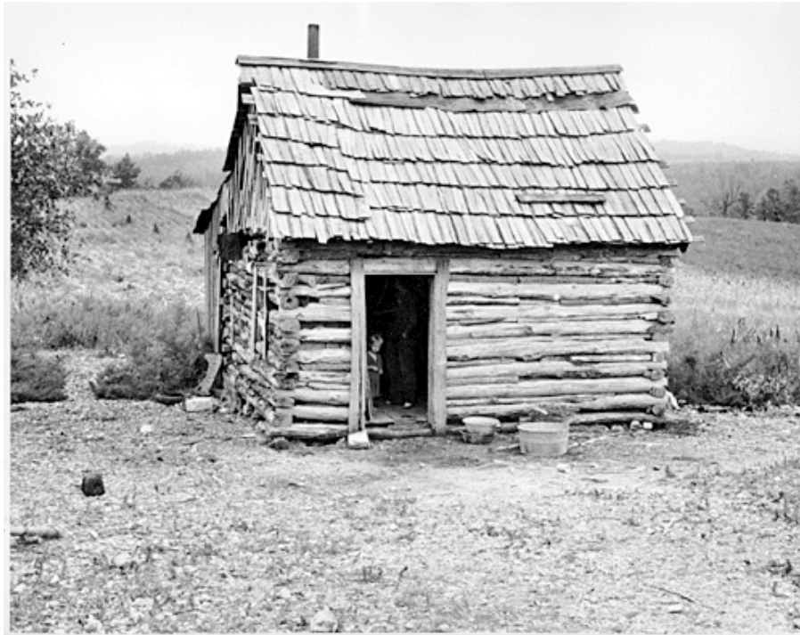
12) Ben Shahn

produit culturel est un bien collectif et influence de manière positive une société ».