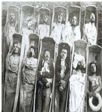
3) Les communards dans leur cercueils

La mutation esthétique apparaît peu à peu autant dans sa thématique que dans le traitement de l'image. Pour expliquer cette mutation du regard porté sur le monde, nous