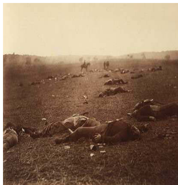
2) Moisson de mort à Gettysburg, Pennsylvanie