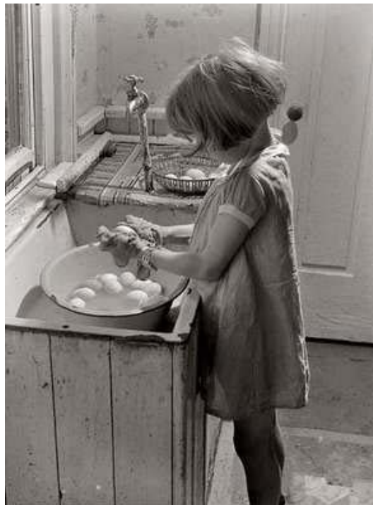
14) Jack Delano