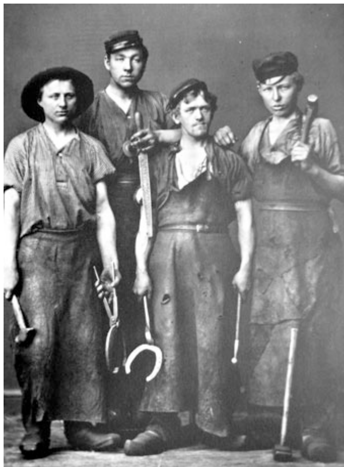
4) Quatre Jeunes Maréchaux-ferrants

distribution d'objets, du choix des attitudes, de sorte que le spectateur puisse immédiatement comprendre ce qui est représenté. Ce sont ces corps visibles qui font la société.