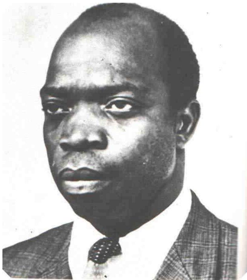
Photo 5: Nerijs Namaso Mbele ancien membre de la Nglo-Batanga Improvement Union T. Eyongetah, R. Brain, 1974, A History of the Cameroon , London, Longman, P. 132.