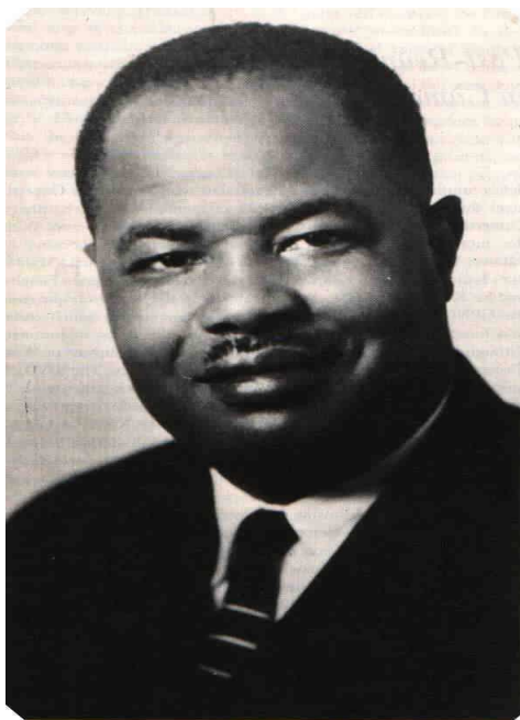
Photo 1: Ahmadou Ahidjo ancien président de l'Association Amicale de la Bénoué T. Eyongetah, R. Brain, 1974, A History of the Cameroon , London, Longman, P. 168.