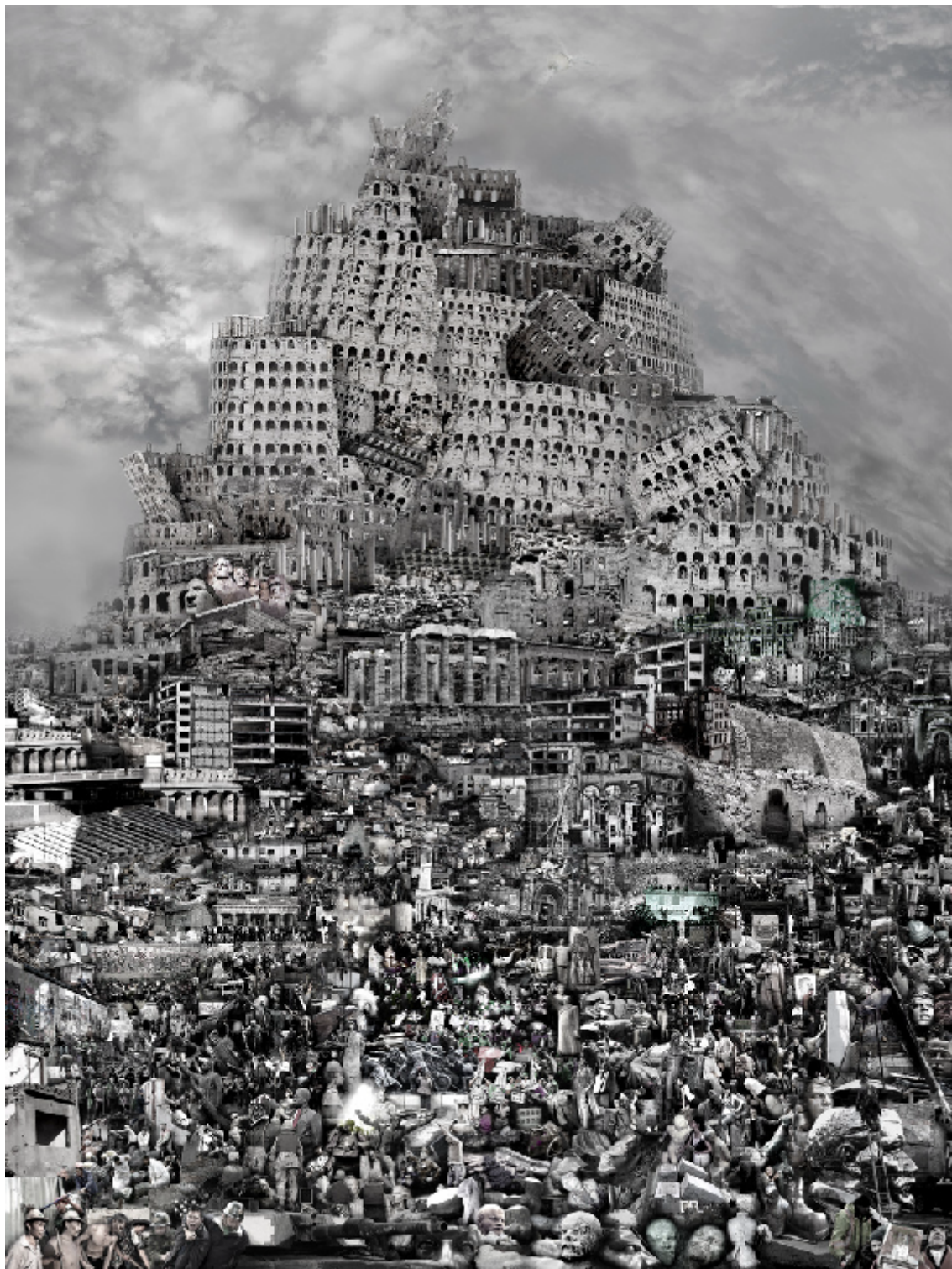
DU ZHENJUN , (Shanghai, 1961), The Tower of Babel : Destruction (2010).

Photographie, dimension variable 120 x 160 cm, 180 x 240 cm.