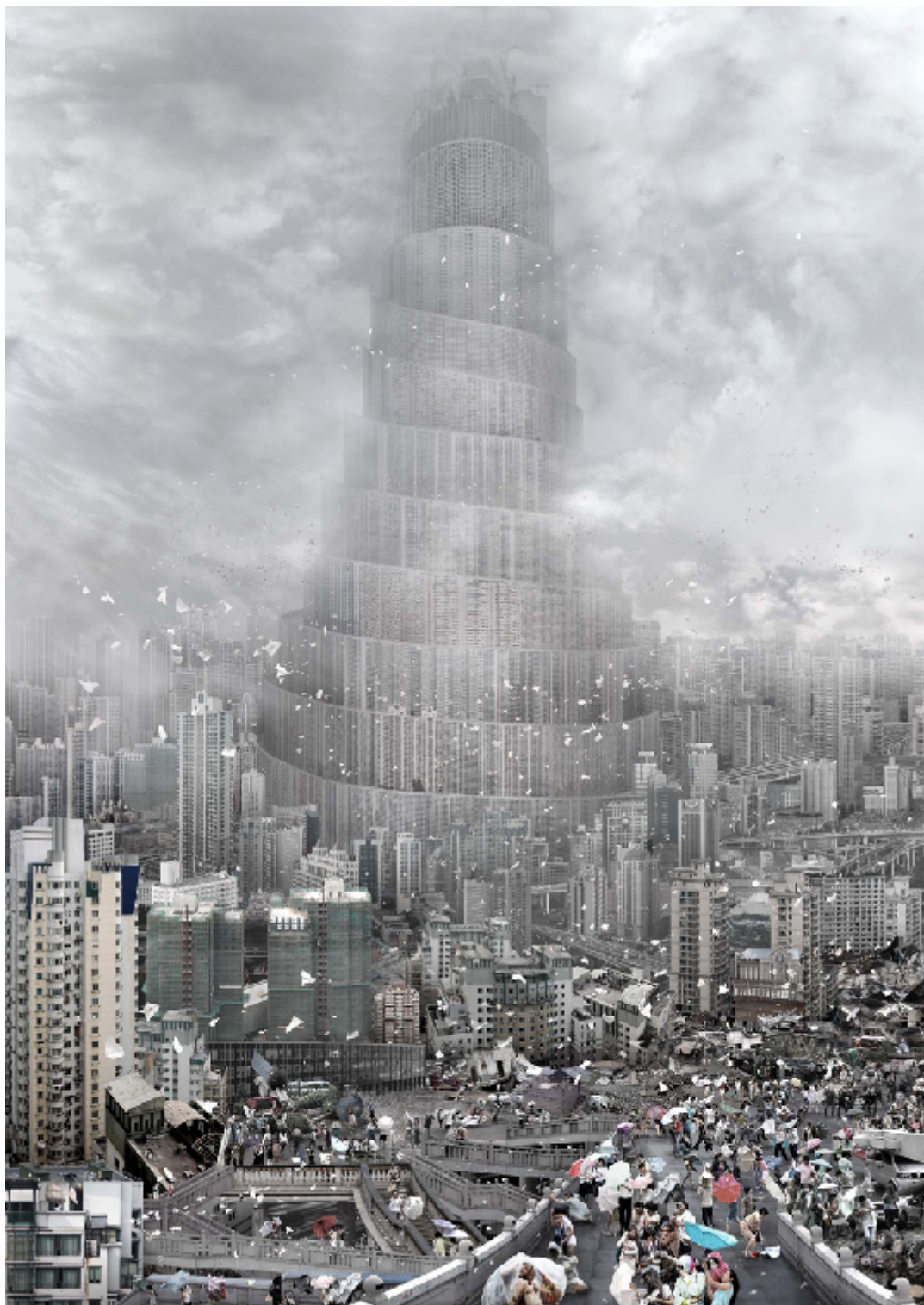
DU ZHENJUN (Shanghai, 1961), The Tower of Babel : the Wind (2010).

Photographie, dimension variable 120 x 160 cm, 180 x 240 cm.