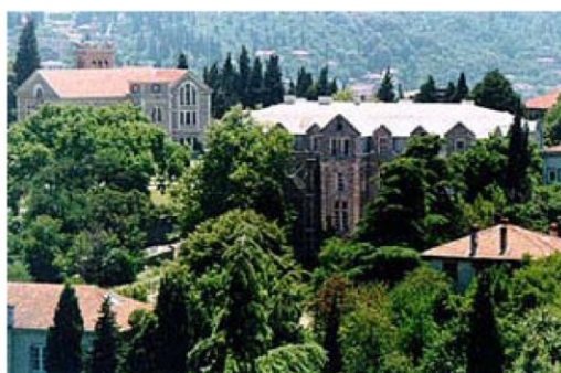
The Bosphorus University

In the decade since its formal launch in 1999, just after NATO's intervention in Kosovo, 23 operations have been organised through ESDP (now renamed CSDP) involving more than 24,000 people. CSDP has made much progress: operations have moved beyond the immediate neighbourhood, and today have a global reach (for example in Georgia, Chad, Somalia and Indonesia) that could barely have been imagined in 1999. On the one hand, ESDP operations still need better coherence between EU institutions, greater unity between Member States and more resources to become more effective; on the other hand, improvements have recently been achieved under the Swedish presidency on issues such as rapid response, qualified personnel, interoperability, financing – in close cooperation with the Commission – and good relations with NATO.