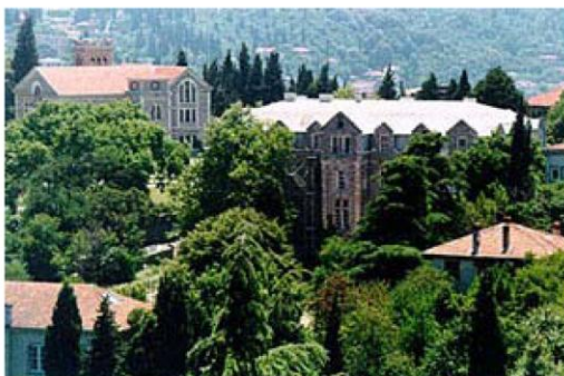
The Bosphorus University

In the decade since its formal launch in 1999, just after NATO's intervention in Kosovo, 23 operations have been organised through ESDP (now renamed CSDP) involving more than 24,000 people. CSDP has made much progress: operations have moved beyond the immediate neighbourhood, and today have a global reach (for example in Georgia, Chad, Somalia and Indonesia) that could barely have been imagined in 1999. On the one hand, ESDP operations still need better coherence between EU institutions, greater unity between Member States and more resources to become more effective; on the other hand, improvements have recently been achieved under the Swedish presidency on issues such as rapid response, qualified personnel, interoperability, financing – in close cooperation with the Commission – and good relations with NATO.