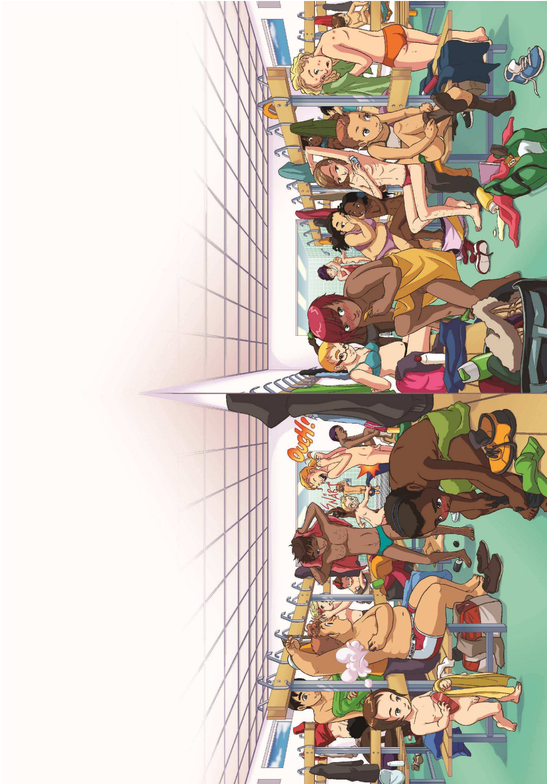
Illustration : © Yokaj Studio, in SIMONSSON Nathalie, Le livre le plus important du monde. À propos du corps, des sentiments et du sexe. Stockholm : Ordfront, 2012, pp. 8-9.