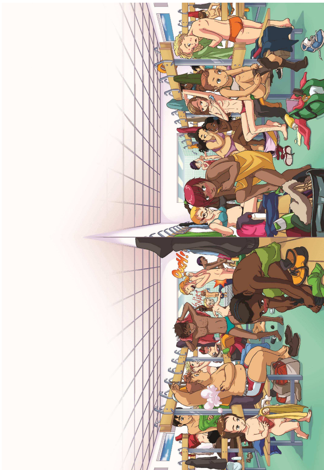
Illustration : © Yokaj Studio, in SIMONSSON Nathalie, Le livre le plus important du monde. À propos du corps, des sentiments et du sexe. Stockholm : Ordfront, 2012, pp. 8-9.