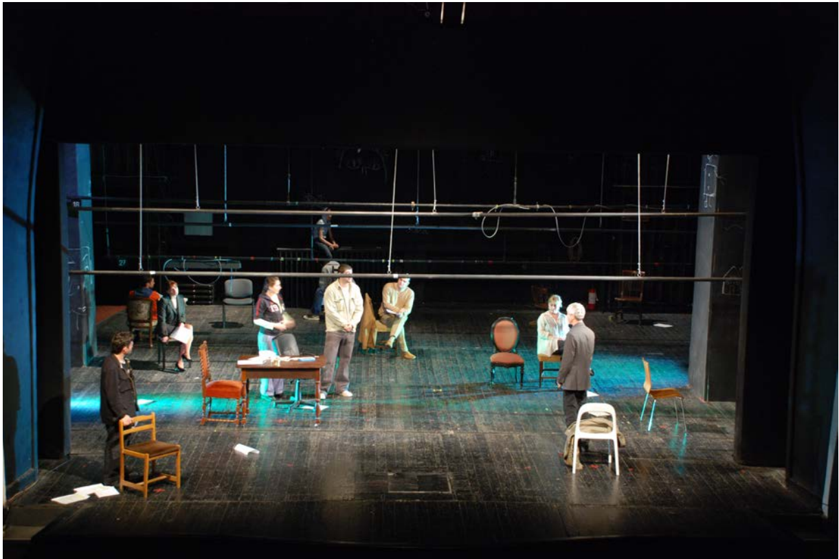
Mise en scène de Claudiu Goga en avril 2008 au Teatrul Mic à Bucarest (Roumanie)

Dans cette mise en scène, le niveau technique (lié au choix de mise en scène) rend lui aussi impossible l'illusion référentielle, même pendant le court instant de la représentation. Tout d'abord, parce que, comme on le voit sur la photographie, tous les personnages sont visibles sur le plateau même quand ils ne sont pas censés être présents sur scène.