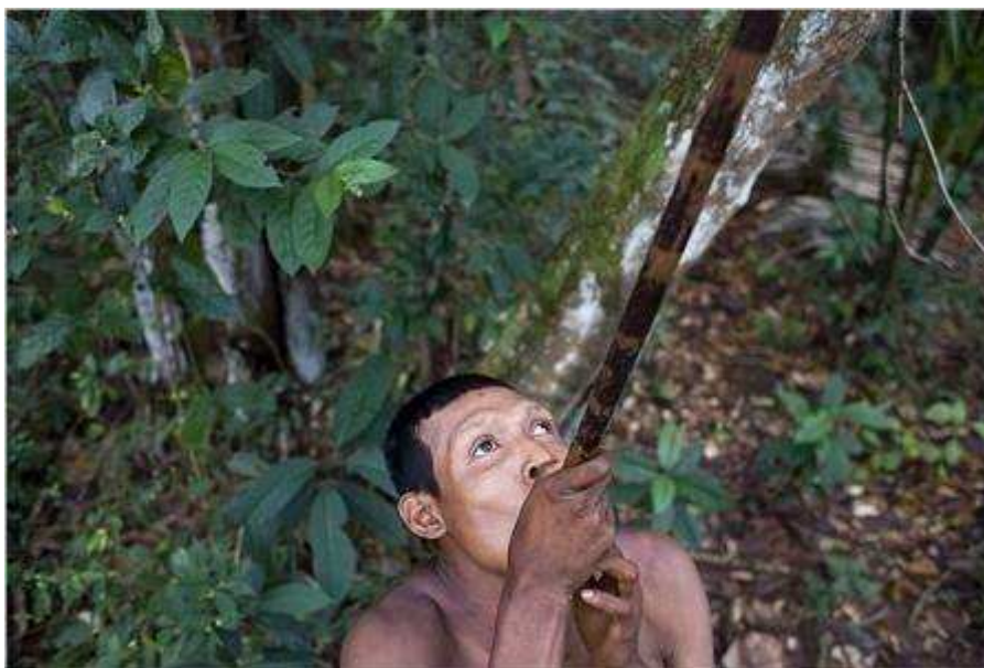
Photo 1 : Homme Nukak chassant des singes en utilisant une sarbacane dont les flèches sont empoisonnées avec du curare.

Un exemple classique est celui du « Curare » ( d-tubocurarine ). Ce nom provient des mots indigènes, « woorari », « woorali », « urari », qui signifient poison. Le chercheur Walter Raleigh et d'autres explorateurs de l'Amérique du Sud ont constaté son utilisation parmi les indiens. C'est le géographe Alexander Von Humboldt qui enregistre pour la première fois cette toxine, en 1807. En réalité, le « Curare » est une désignation générique pour de multiples préparations, qui incluent plusieurs éléments. Les éléments les plus fréquents sont le poison mortel retrouvé dans les feuilles de strychnos toxifera ou s. guianensis et dans la menispermaceae , spécialement le chondrodendron tomentosum ou la sciadotenia toxifera . La méthode usuelle de préparation consiste dans la combinaison des jeunes feuilles de strychnos et de menispermaceae avec d'autres fragments de feuilles ou poison animal. Le mélange est porté à ébullition pendant près de deux jours afin de faire évaporer le maximum de liquide pour obtenir une pâte sombre et épaisse qui sera utilisée lors de la chasse et des combats.