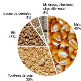
FIGURE 1.2.1: Un exemple d'aliment

Actuellement, les formules sont élaborées de façon à ce que le produit fini soit directement issu du mélange de matières premières. Chaque matière première a des caractéristiques particulières, comme un certain taux de glucide, de lipide, etc. Ces caractéristiques sont transmises linéairement aux mélanges. Une recette est généralement exprimée en pourcentages qui représentent les taux d'incorporation des matières premières qui sont mélangées. Un exemple est donné dans la Figure 1.2.1.