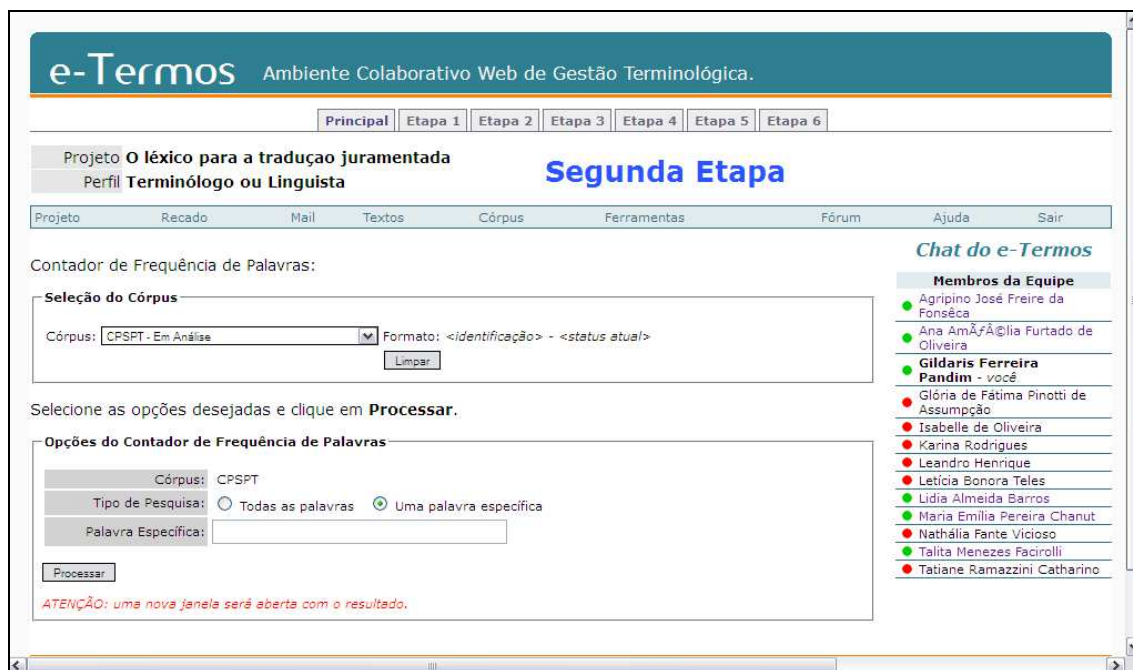
Figura 4 – Interface da segunda etapa do E-terms