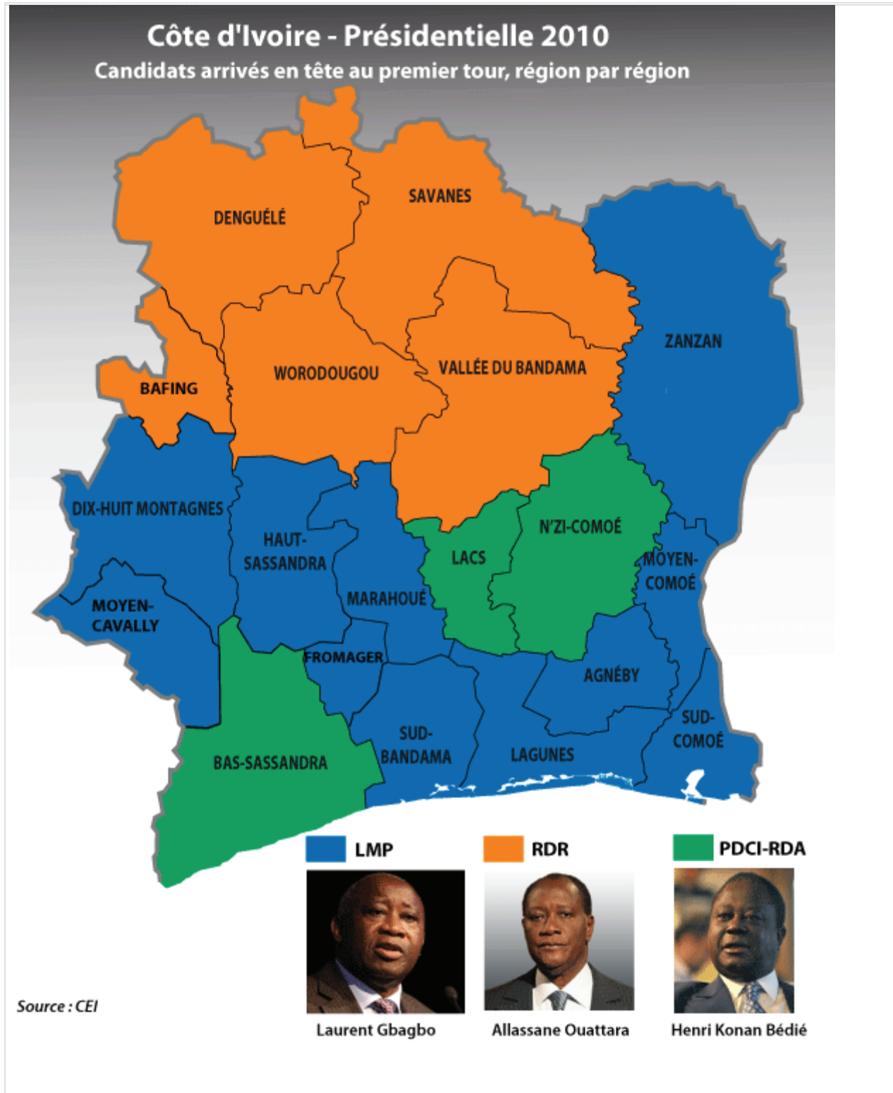
Carte des résultats du premier tour de la présidentielle ivoirienne