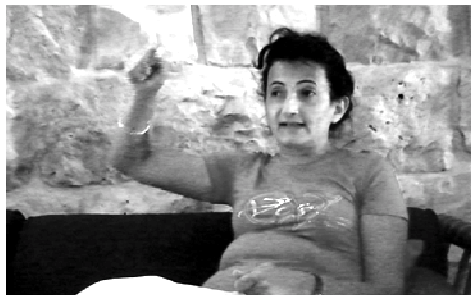
ou je te coupe avec l'épée