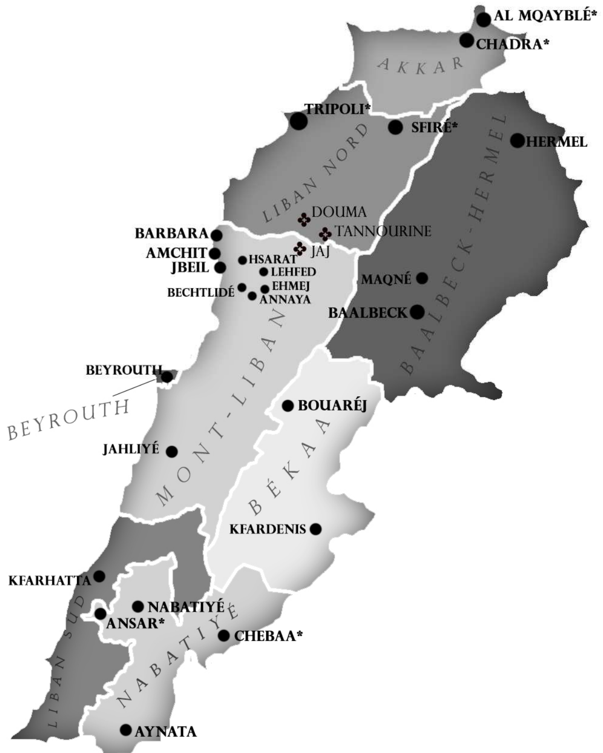
Carte 1 Les différentes mohafazats du Liban et les villes et villages où les contes ont été collectés (indiqués par ●).

* Villes et villages où la collecte a été effectuée par Samia Salloum