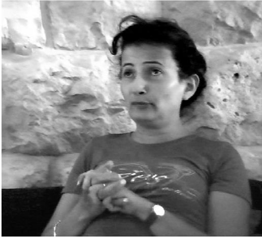
Elle dit au prince