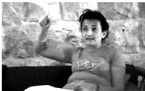
ou je te coupe avec l'épée