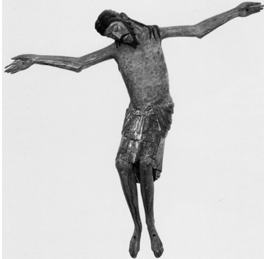
32. Christ en déposition, église S. Marie de Formiguères, deuxième moitié du XIIIe siècle.

Le Christ en Croix de la collégiale Saint-Junien (Limousin) après sa restauration en 2007 est confirmé comme Christ de crucifixion 138 . Le torse de Christ provenant de Lavadiou dans la Cloister Collection, le torse du Philadelphia Museum, et le corps du Christ de Saint-Marcel (Eure) Normandie, même s'ils ont une inclinaison vers la droite, sont trop lacunaires pour être considérés de façon certaine comme Christ en déposition.