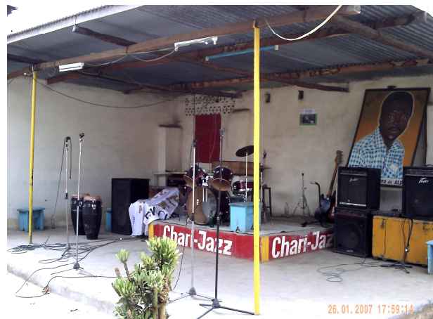
La scène du Temple de Chari Jazz