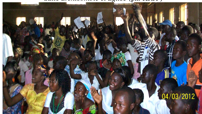
Salle archicomble et agitée