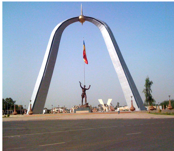
Photo n° 14 L'arche de la Place de la Nation, symbole de la grandeur et des ambitions

Par ailleurs, si l'image de la « Place de l'Indépendance » était associée à la dimension historique du lieu, celle de la « Place de la Nation », quant à elle, répond à une nouvelle vision politique des autorités baptisée la « renaissance ». La Place de la Nation symbolise ce temps nouveau de la renaissance, qui évoque le Tchad pacifié et celui des grandes ambitions.