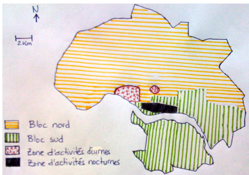
Figure 2 : Les 2 blocs et les zones de concentration des activités diurnes/nocturnes

Malgré cette opposition des cultures et des pratiques que nous avons signalée, on note cependant que les nombreux établissements de consommation d'alcool que sont les bars constituent des points de rencontre des citoyens et des communautés ; ils offrent ainsi une mixité intéressante pour notre étude.