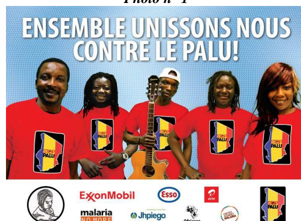
L'un des panneaux observables sur les grandes artères de la ville