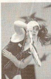
« Mon corps dit stop », a déclaré, hier, Marion Bartoli après avoir été éliminée par l'Australienne Dellacqua.

Un poil moins expérimentés (26 ans) que leurs aînés, Julien Benneteau et Paul-Henri Mathieu ont bénéficié d'un soutien populaire sans faille pour cauler respectivement le guerrier américain Vincent Spadea (6-4, 6-4, 3-6, 3-6, 6-3 au 1 er tour en 3 h 11) et l'ouvrier espagnol Oscar Hernandez (2-6, 1-6, 6-4, 6-3, 6-2 au 2 e tour en 4 h 11) au terme de deux combats en cinq manches