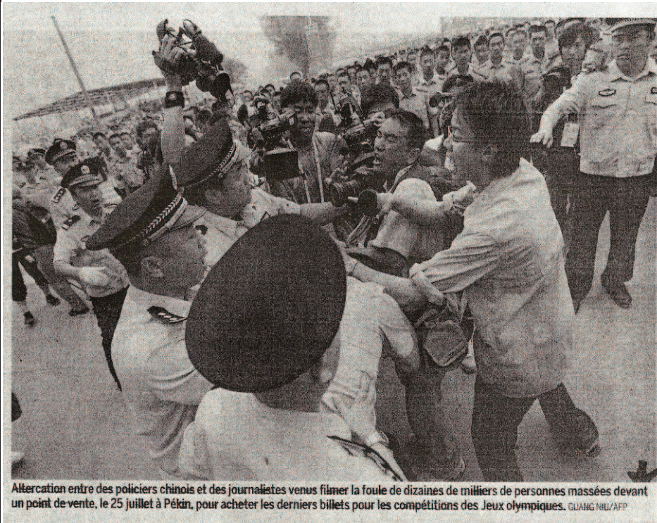
Altercation entre des policiers chinois et des journalistes venus filmer la foule de dizaines de milliers de personnes massées devant un point de vente, le 25 juillet à Pékin, pour acheter les derniers billets pour les compétitions des Jeux olympiques.

« Inquiétudes sur les JO de Pékin », Le Monde , 27.07.08, p. 1.