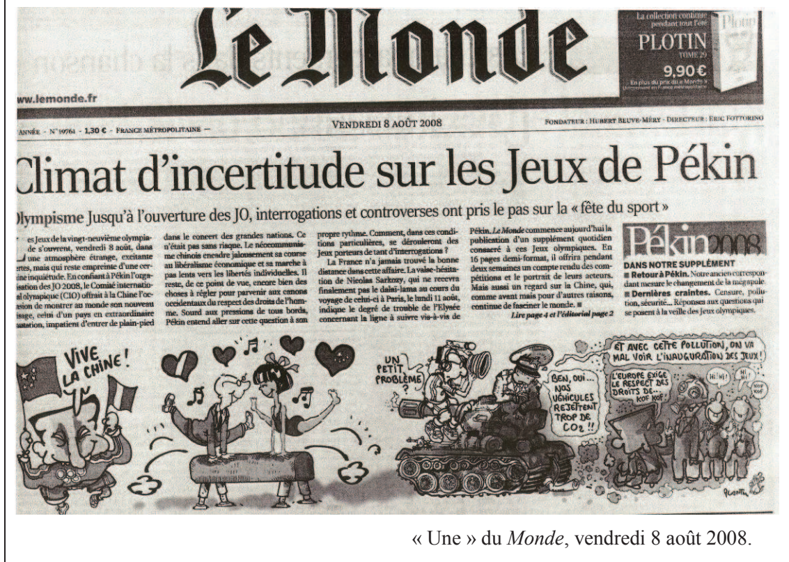
« Une » du Monde , vendredi 8 août 2008.

Ces controverses et inquiétudes évoquées par le quotidien concernent divers paramètres. Le Monde évoque la privation des libertés individuelles et la question des droits de l'homme en Chine. Le dessin qui accompagne le texte laisse également penser que la pollution est un paramètre supplémentaire. La focale placée sur le smog jaune qui plane au-dessus de Pékin en raison des rejets massifs de CO 2 et altère la visibilité interpelle depuis l'attribution de l'événement à la Chine, en juillet 2001 617 . Ces deux occurrences relatées dans les colonnes du journal ne sont pas les seules. Un journaliste de sport à Libération relève pour sa part la crainte de manifestations d'hostilité, plus ou moins violentes, vis-à-vis du pouvoir chinois en place. Cette crainte des débordements « éclate avec les insurrections au Tibet. C'était en mars, je crois. La tension était forte, je me souviens. D'une part, car les Tibétains faisaient leur retour dans l'actualité de façon dramatique. Et d'autre part, ces événements arrivaient dans la ligne droite