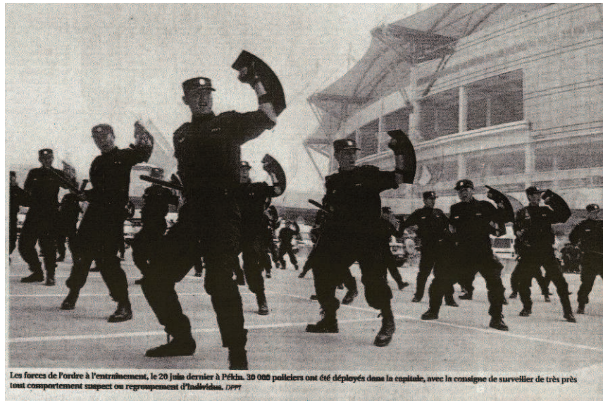
Les forces de l'ordre à l'entraînement, le 20 juin dernier à Pékin. 30 000 policiers ont été déployés dans la capitale, avec la consigne de surveiller de très près tout comportement suspect ou regroupement d'individus. DFPF

« Avec le temps, l'anxiété des organisateurs se reporte sur d'autres soucis possibles, en l'occurrence la sécurité et d'une manière plus générale le climat des Jeux. Signe de cette nervosité croissante, le slogan « des Jeux sans incidents » s'est imposé au fil des jours dans les esprits et sur les affiches. »