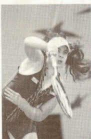
« Mon corps dit stop », a déclaré, hier, Marion Bartoli après avoir été éliminée par l'Australienne Dellacqua.