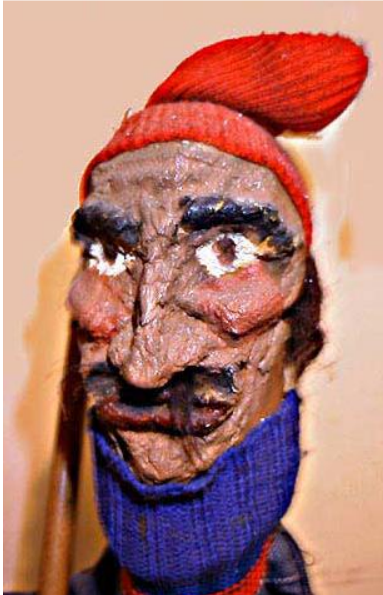
Photographie 3 : Le conteur balayeur, dans Amachaou ou il était une fois mon bled (1978) de la troupe Nedjma 832 .

Les auteurs et troupes issus de l'immigration mettent régulièrement en scène des personnages tirés de la littérature orale et des légendes. Les thèmes développés s'inspirent du quotidien de l'immigration, sous l'angle de la farce et du burlesque, avec des personnages et parfois des situations puisés dans l'univers du conte et du merveilleux. Il est donc courant de retrouver des personnages directement issus de la tradition populaire comme Djeha, épicerie de la tradition orale, un personnage bien connu dans les pays du Maghreb, plus largement dans le Maghreq. C'est le