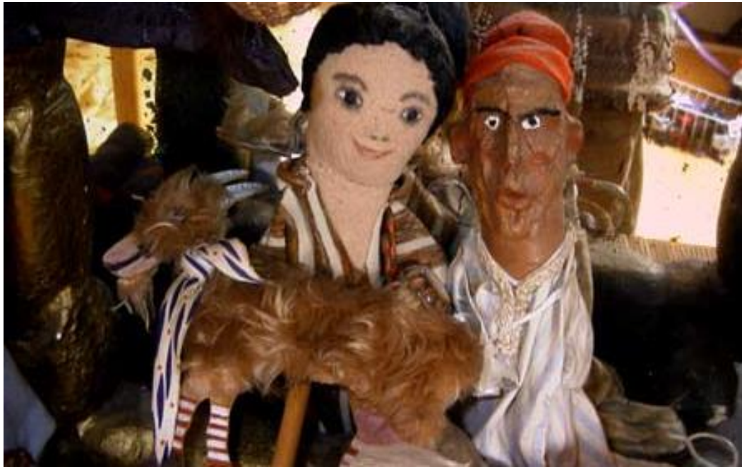
Photographie 4 : Djeha le vendeur de chèvres, dans Amachaou ou il était une fois mon bled (1978) de la troupe Nedjma 833 .

cas dans le spectacle Amachaou ou il était une fois mon bled , spectacle dans lequel le conteur balayeur retrouve la marionnette Djeha, un vendeur de chèvre.