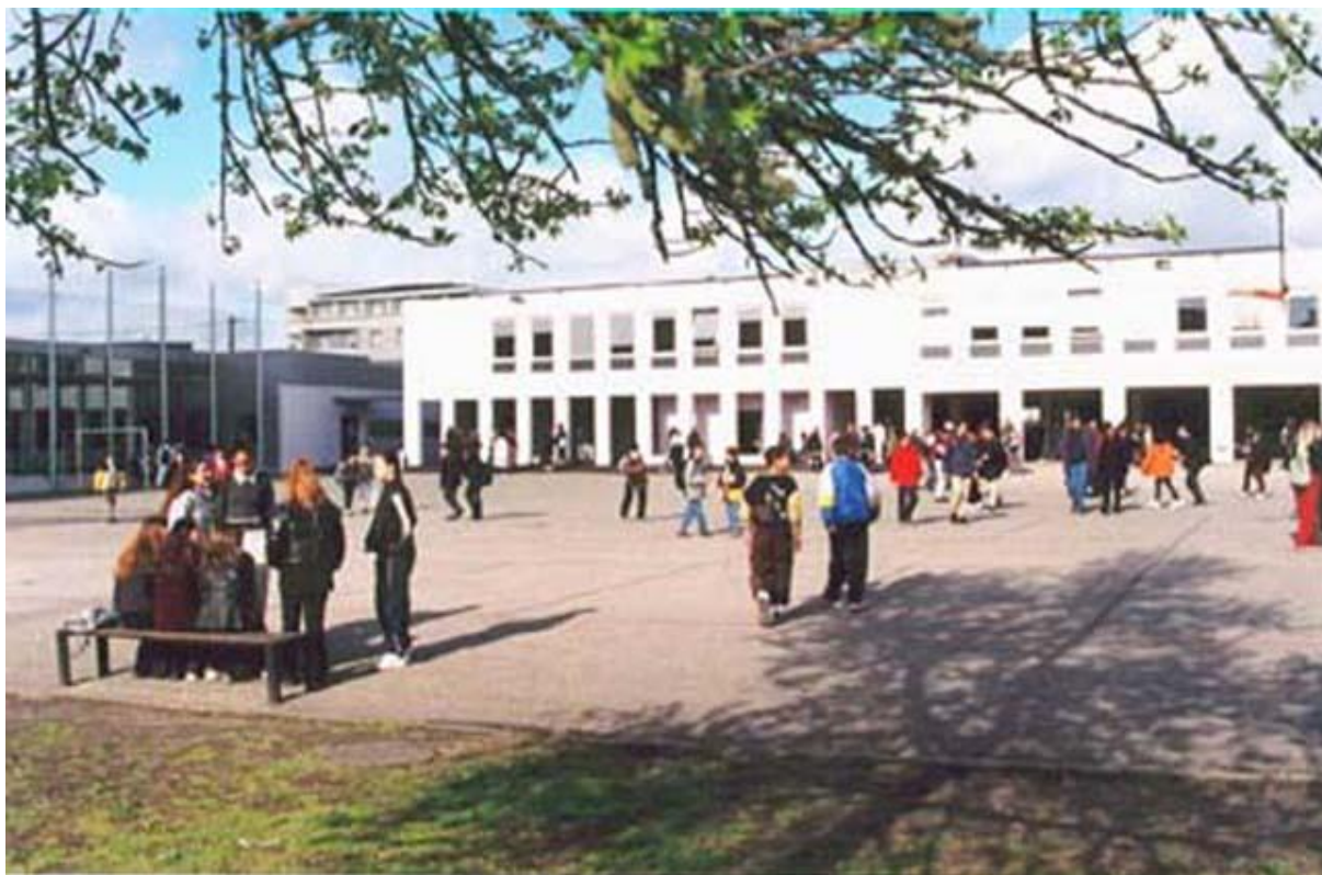
Figure n° 2 : COLLEGE EDOUARD VAILLANT DE BORDEAUX